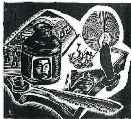
鲁迅先生(原名《静物》) 赖少其

本报电(闻逸)由上海市文化和旅游局、安徽省文化和旅游厅作为指导单位，中华艺术宫(上海美术馆)、合肥市赖少其艺术馆主办的“木石精神——赖少其艺术文献展”日前在中华艺术宫开幕。本次展览展出赖少其生平相关作品近100件，文献史料实物及历史照片约200件(套)。