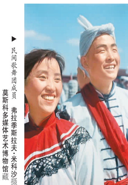
民间歌舞团成员

今年正值中国共产党成立100周年，也是中俄睦邻友好合作条约签署20周年。中国美术馆馆长吴为山表示，米科沙的摄影作品具有与众不同的纪实性，凝固了时代的精彩瞬间，是珍贵的历史影像，不仅记录了中国人民“站起来”的庄严时刻，也增进了中俄两国人民的了解和互信。