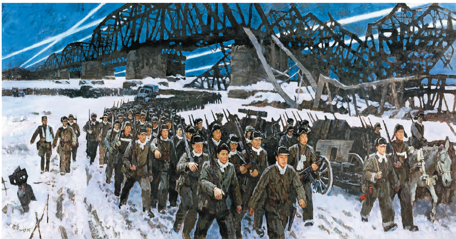
▲ 跨过鸭绿江(油画) 吴云华 中国美术馆藏