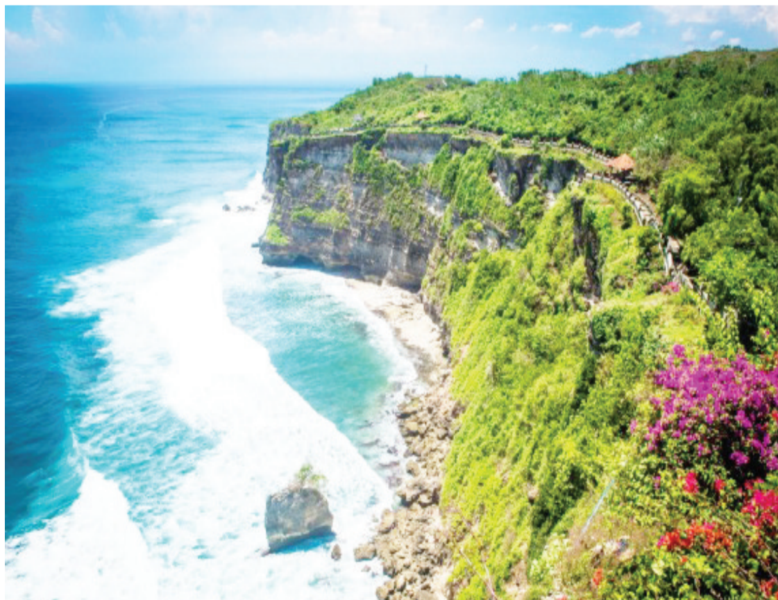
2016年9月29日在印度尼西亚巴厘岛拍摄的情人崖。