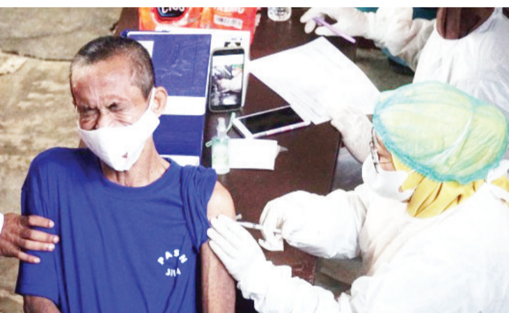
8月4日,医务人员在印度尼西亚西爪哇省勿加泗给一名男子接种新冠疫苗。