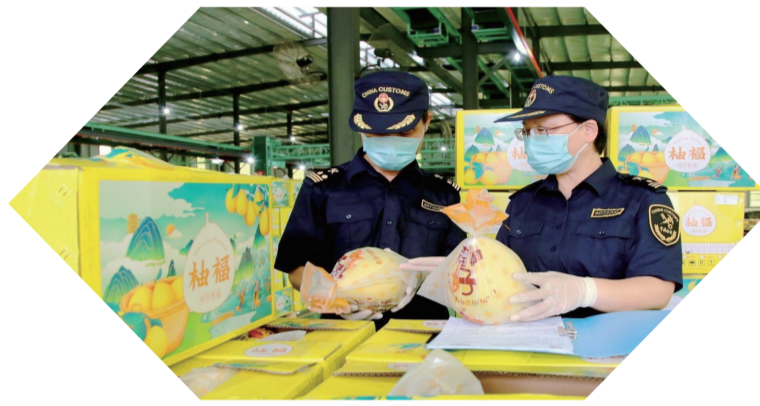
梅州海關對出口蜜柚進行檢疫監管。