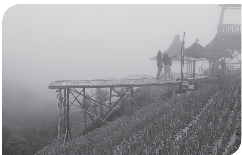
LAHAN PERTANIAN DIJADIKAN TEMPAT WISATA

Bima juga menyampaikan partai berlabang matahari putih itu memiliki tokoh internal yang dijagokan untuk Pilpres 2024, yakni ketua umumnya Zulkifli Hasan, Ketua Dewan Kehormatan PAN Soetriono Bachir yang saat ini masih mengisi kepemimpinan nasional. "Tentu pada saannya PAN akan menentukan, bisa salah satu dari mereka atau bahkan di luar dari mereka, masih panjang," katanya. yan