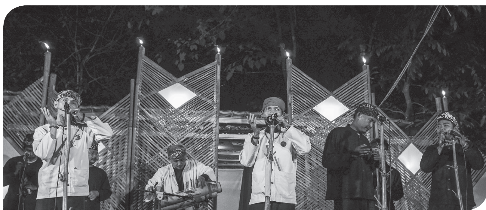
PENTAS NGARUWAT LEMBUR

Seniman karinding Kasalur yang tergabung dalam Komunitas Cermin Tasikmalaya (KCT) tampil pada acara Ngaruwat Lembur 2 di Bukit Lestari, Kota Tasikmalaya, Jawa Barat, Sabtu (9/10) malam. Ngaruwat Lembur 2 bertujuan untuk melestarikan kesenian tradisional sunda khas Tasikmalaya yang nyaris punah dan menyambut Hari Jadi Kota Tasikmalaya ke-20.