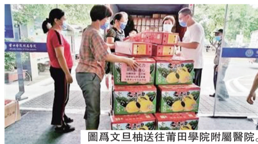
圖為文旦柚送往莆田學院附屬醫院。