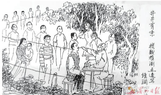
省美協會員、市美協副主席、市誠信書畫院藝術顧問許經潤 作