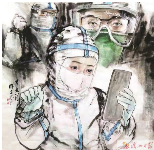
福建省美術家協會會員、市誠信書畫院特聘書畫師、莆田電大國畫教師許立忠 作