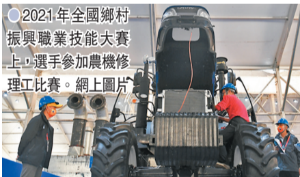
2021年全國鄉村振興職業技能大賽上，選手參加農機修理比賽。

2016年2月，中國印發第一個人才發展體制機制改革綜合性文件《關於深化人才發展體制機制改革的意見》，核心就是「放權、鬆綁」。此後，《關於深化職稱制度改革的意見》《關於深化項目評審、人才評價、機構評估改革的意見》《關於促進勞動力和人才社會性流動體制機制改革的意見》等改革文件先後出台，以改革紅利釋放人才紅利。在這次中央人才工作會議上，習近平重點談到深化人才發展體制機制改革，進一步釋放「放權、鬆綁」的信息。總書記指出，要根