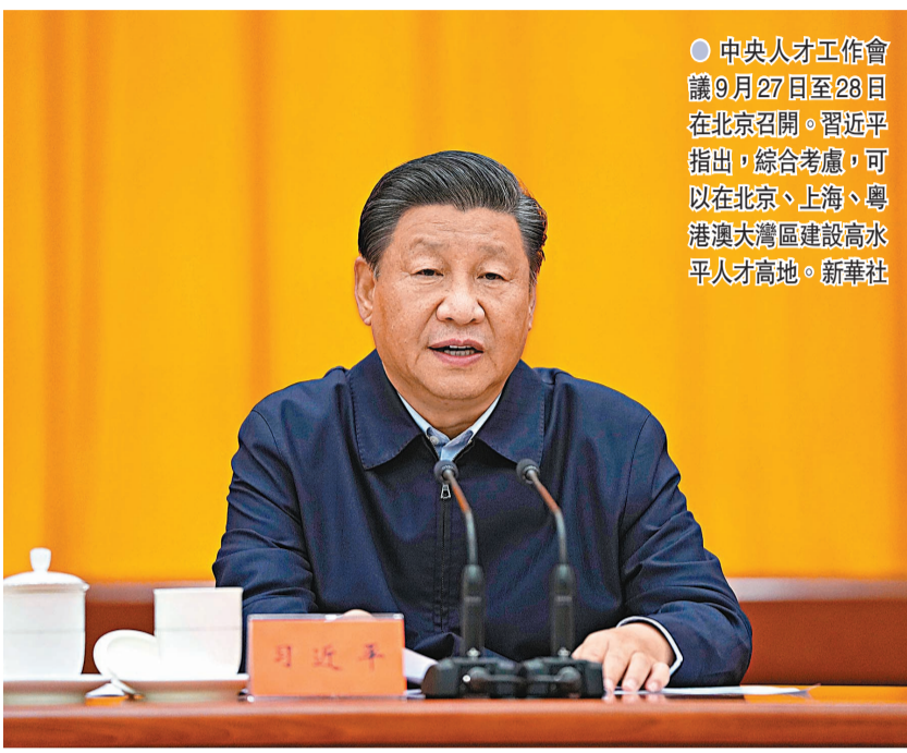
中央人才工作會議9月27日至28日在北京召開。習近平指出，綜合考慮，可以在北京、上海、粵港澳大灣區建設高水平人才高地。新華社

習近平指出，各級黨委（黨組）要完善黨委統一領導，組織部門牽頭抓總，職能部門各司其職、密切配合，社會力量廣泛參與的人才工作格局。各地區各部門要立足實際、突出重點，解決人才反映強烈的實際問題。要加大人才發展投入，提高人才投入效益。各級黨委宣傳部門，各級政府教育、科技、工信、安全、人社、文旅、國資、金融、外事等部門，要充分發揮職能作用，共同抓好人才工作各項任務落實。