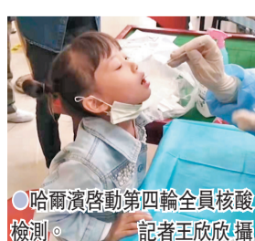
哈爾濱啓動第四輪全員核酸檢測。

福建省疫情防務工作取得階段性成效。莆田市已連續5天社區陽性零增加，連日4天全市陽性零增加，仙游縣連續5天無新增病例。中國國務院聯防聯控機制於同日召開新聞發布會指出，近期發生的福建疫情已基本得到有效控制，要鞏固防控成果，防止疫情反彈。黑龍江疫情正處於關鍵時期，需繼續加大防控力度，堅決遏制疫情擴散蔓延。