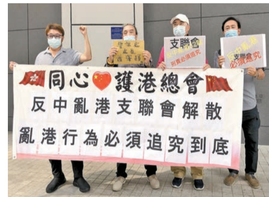
團體「同心護港總會」到警察總部請願，要求警方徹查支聯會。

【香港商報訊】民間團體「同心護港總會」昨日到灣仔警察總部請願，要求警方徹查支聯會，對反中亂港人士追究到底、繩之於法。團體指，支聯會成立32年來不停抹黑中央政府、誤導香港市民，令部分香港市民對特區政府不滿；自去年香港國安法成立後，支聯會還不收手，繼續破壞香港法治，搞亂香港。支聯會解散明顯想避刑責，故此要求警方徹查這班反中亂港人士，必須追究到底將其繩之於法。