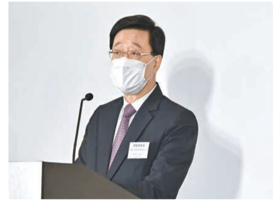
李家超表示，將強化本港防控抗疫工作，期望早日通關。

展望未來，李家超稱，在國家「十四五」規劃和雙循環策略下，香港憑藉「一國兩制」的獨特優勢，將有無限發展空間，經濟環境逐步向好，成就更多傑出企業。