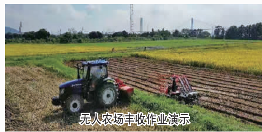
无人农场丰收作业演示

黄埔文化集团加快推进隆平稻香园和隆平院士港建设，结合农文旅融合发展，提升大吉沙岛基础设施和