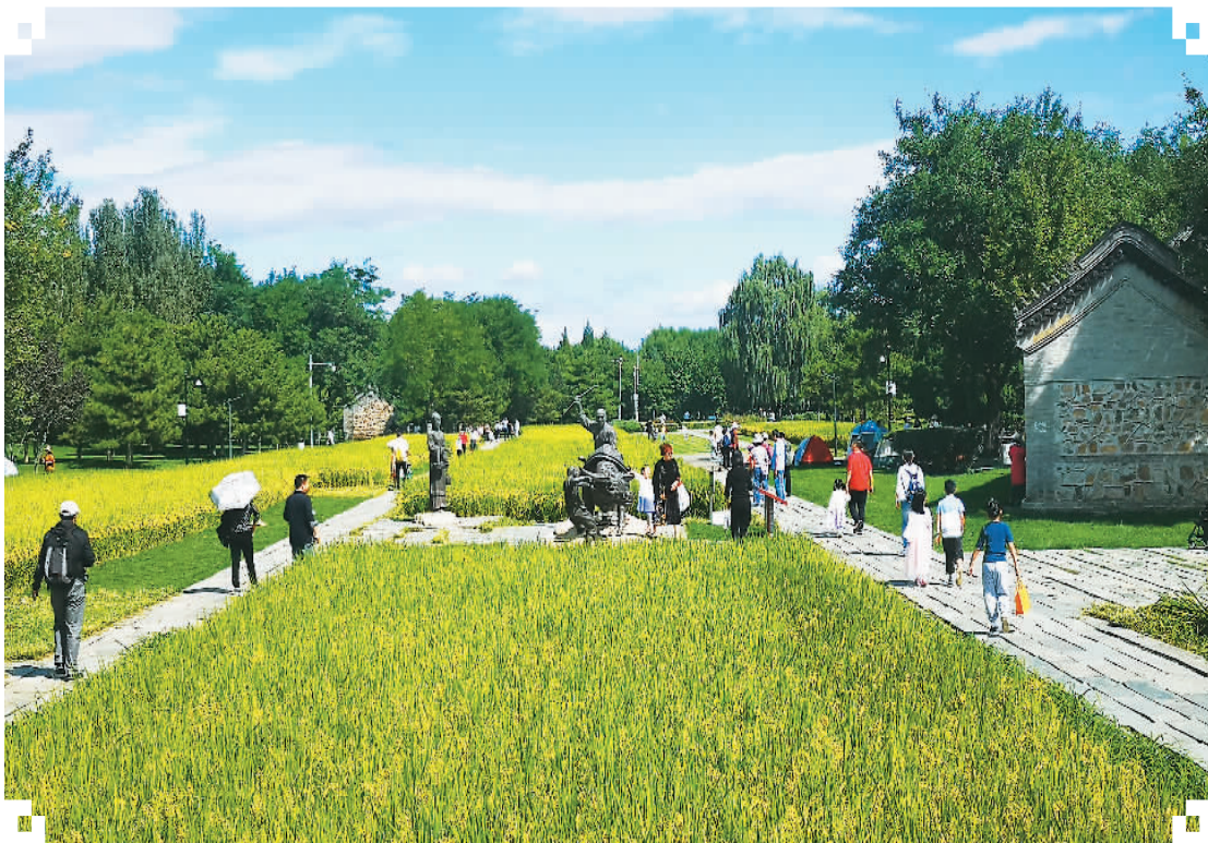
游客在北京北坞公园的稻田种植区域休闲赏景。

正值金秋,全国由北至南进入赏秋佳季。将赏秋景与中国农民丰收节相结合,不断丰富秋游内涵,并展现中国乡村新貌,正成为秋游中国的新看点。