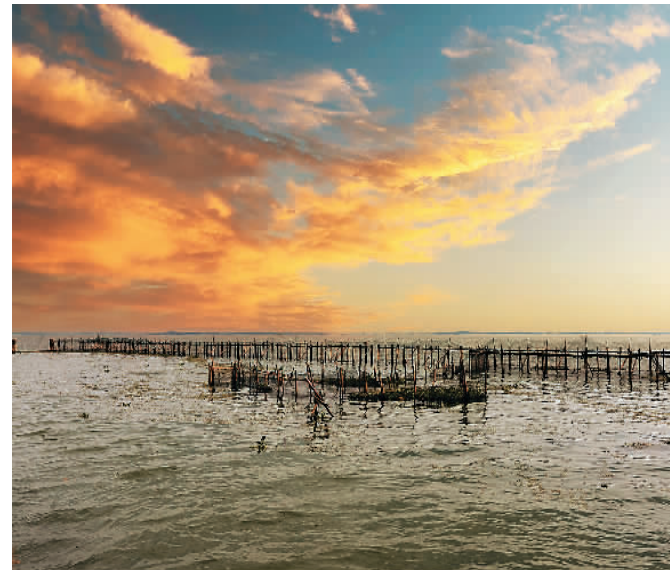
苏州市吴中区角直澄湖风光

水花。田埂上的女娃娃,挥舞着手里的玉米秆,欢呼雀跃:“好多泥鳅,哎呀,哎呀,还有小鱼!”此般情景,叫人怎能不忆年少?这是记忆中的江南,姑苏城外澄湖畔,碧波万顷,良田万亩。你看,你喜欢的鸡头米,长在这铺满水田的绿毯里,趁着雨后的清凉,抓紧抢抓这一亩果实。白鹭翱翔天际,盘旋着落入农夫走过的田地,追逐着虫蛾还有水洼里的小鱼。