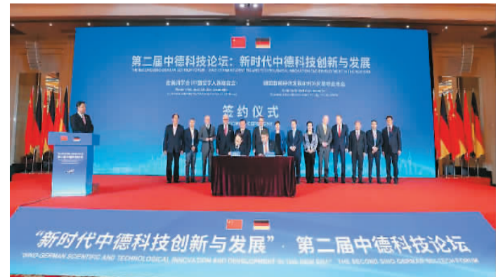
2019年11月，北京市欧美同学会承办的第二届中德科技论坛在京举行。

2020年9月，北京市欧美同学会组织召开北京市“十四五”规划研讨会，形成建言专报6篇，为“十四五”规划提供智力支持。今年全国两会期间集中报送建言专报47篇。此外，北京市欧美同学会还召开各区座谈会，加强与北京市教委等单位的沟通，形成《关