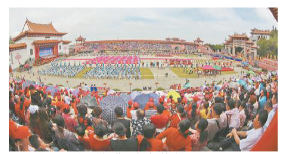
媽祖祭典現場氣勢恢宏。

來湄洲島參加媽祖文化研習營活動；在紀念媽祖羽化升天1033周年暨媽祖繞境巡安湄洲島海祭活動期間，邀請臺商臺胞前來參加盛會；今年祖廟舉辦“兩岸同祈福，共啟新徵程——辛醜年湄洲媽祖祖廟攜手臺灣宮廟線上線下新春祈年活動”……這些活動通過兩岸視頻連線、網絡直播等形式呈現，傳播效果好，影響深遠。(林群華 周建國/文)