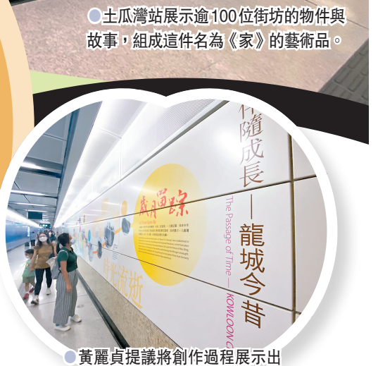
●土瓜灣站展示逾100位街坊的物件與故事，組成這件名為《家》的藝術品。