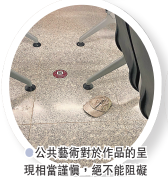
●公共藝術對於作品的呈現相當謹慎，絕不能阻礙乘客，因而設於椅下。