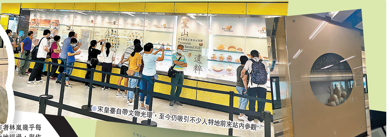
●宋皇臺自帶文物光環，至今仍吸引不少人特地前來站內參觀。