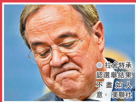
●拉舍特承認選舉結果不盡如人意。

德國國會大選初步點票結果顯示，中間偏左的社會民主黨 (SPD) 以 25.7% 得票率，些微優勢領先現任總理默克爾所屬的中間偏右基督教民主聯盟 (CDU) 及姊妹政黨基督教社會聯盟 (CSU)。今次大選各黨得票的分散程度是戰後之最，預料組閣談判所花時間可能比上屆大選的 5 個多月更久，並可能出現歷來首次三黨聯合執政。社民黨總理候選人朔爾茨 27 日表示，得票大落的基民盟及基社盟已經失去管治資格，揚言要在聖誕前完成籌組新政府。