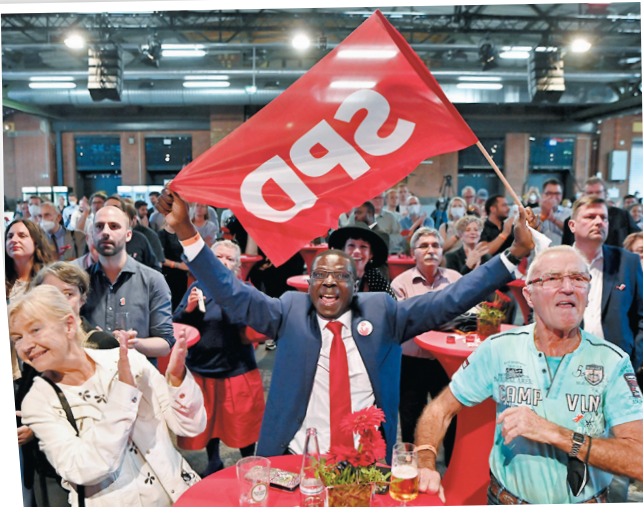
●社民黨支持者揮舞旗幟慶祝。