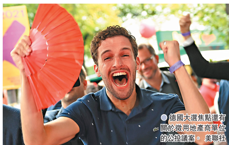
●德國大選焦點還有關於徵用地產商單位的公投議案。