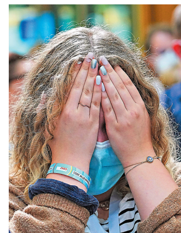
●基民盟支持者對選情失望。