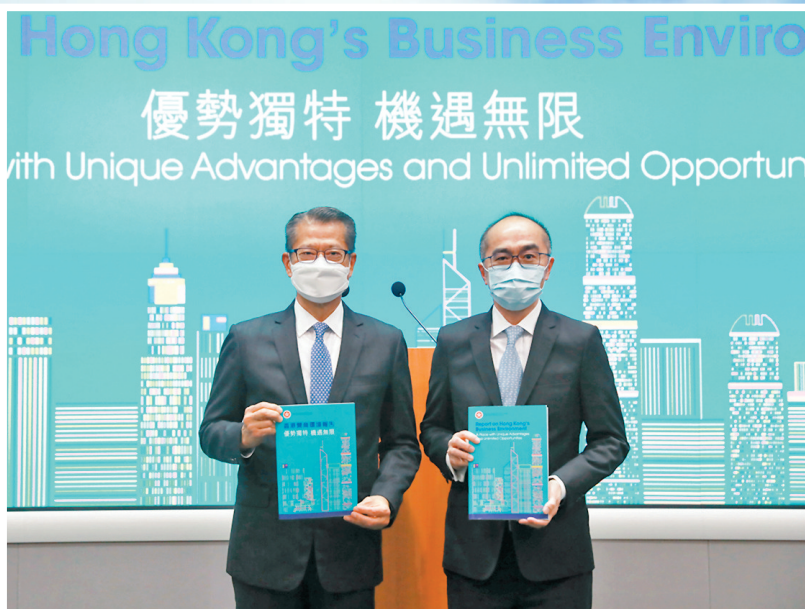
財政司司長陳茂波在記者會上表示，我們不怕外國的抹黑和遏制，必須說好「香港故事」。