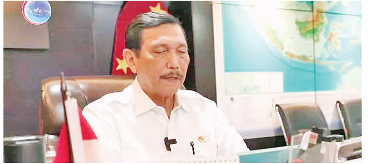
印尼海事和投资统筹部长卢胡特致词

【本报讯】2021年9月28日下午15时，中国驻印尼大使馆和中国驻东盟使团举行线上招待会，隆重庆祝中华人民共和国成立72周年。