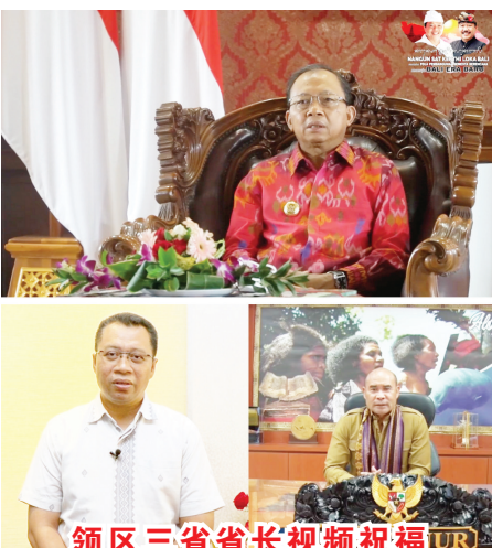
领区三省省长视频祝福