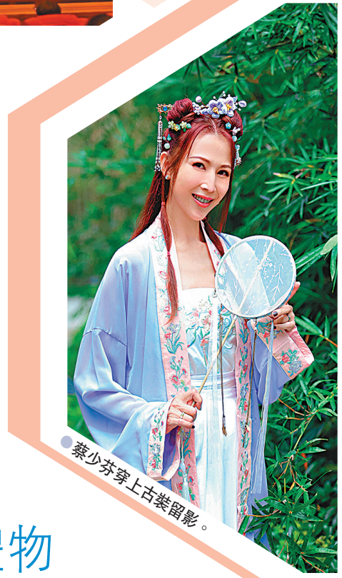
●蔡少芬穿上古裝留影。

香港文匯報訊(記者阿祖)「大美人」關之琳(之之)於日前度過59歲生日，她亦於社交平台分享生日派對上開心切蛋糕一刻的片段。壽星女之之身穿綠色連身裙，襯起來十分青春，加上她凍齡有術，完全看不出其實年齡。之之有她的公仔造型和巨型香檳的蛋糕前合十感謝好友到來為她慶生，壽星女即忙個不停跟好友們碰杯答謝，其間更熱情地向友人送上飛吻，表現得十分開心。