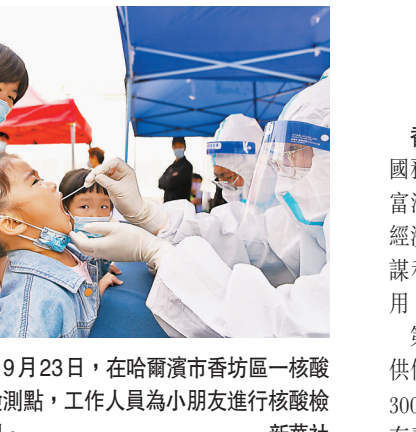
9月23日，在哈爾濱市香坊區一核酸檢測點，工作人員為小朋友進行核酸檢測。