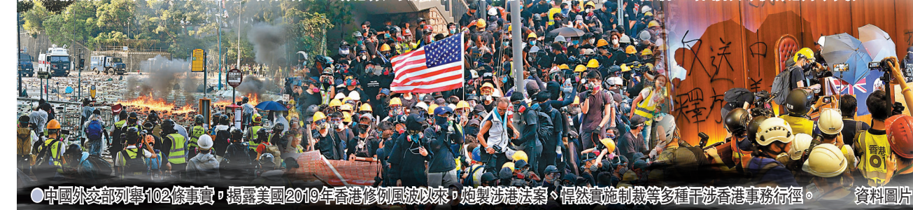
中國外交部列舉102條事實，揭露美國2019年香港修例風波以來，炮製涉港法案、悍然實施制裁等多種干涉香港事務行徑。

特區政府感謝中央果斷行動，在關鍵時刻制定實施《香港國安法》，防範、制止和懲治危害國家安全的行為。再通過完善香港特區選舉制度，從制度上全面貫徹落實「愛國者治港」原則。 特區政府將繼續堅定地執行《香港國安法》及全面貫徹落實「愛國者治港」原則，堅決反對及防止外力干預香港內部事務。