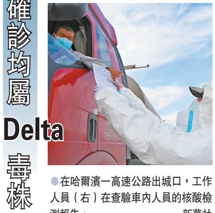
在哈爾濱一高速公路出口，工作人員(右)在查驗車內人員的核酸檢測報告。

「民主不是哪個國家的專利，而是各國人民的權利。」在21日舉行的第七十六屆聯合國大會一般性辯論上，中國國家主席習近平發表重要講話時的一論述，發人深省。次日，中國駐美大使在卡特中心和喬治·布什美中關係基金會上演講時，詳細闡釋了何為中國式民主。 這是一個值得世界深入思考和交流探討的話題。人們不能陷入某些西方政客設下的「民主對專制」的話語陷阱，誤把「反華」當作維護「民主」，從而將世界推向危險的意識形態對抗與人為製造的分裂當中。 民主一詞源於古希臘，本意是「人民統治」。縱觀兩千多年西方發展史，這一理念並未得到真正實現。但西方特別是美國憑借強大的經濟、軍事力量，企圖掌控世界民主政治的話語權，將民主簡化為「一人一票」加「多黨制」，並以此作為模範衡量他國政治體制——符合的就是「民主國家」，不符合的就是「專制國家」。 這種將中西方關係渲染為「民主對專制」的做法，本身就不民主。美國沒有資格單方面定義並專享「民主」，更沒有資格將自己的標準強加於人，甚至搞所謂的「民主改造」。 世界各國形態多樣，每個國家都有權利選