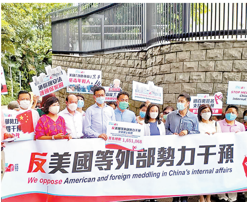
去年七月，香港各界携國安法聯合陣線到美國駐港總領事館，遞交165萬個「反美國等外部勢力干預」的簽名。

「民主不是哪個國家的專利，而是各國人民的權利。」在21日舉行的第七十六屆聯合國大會一般性辯論上，中國國家主席習近平發表重要講話時的一論述，發人深省。次日，中國駐美大使在卡特中心和喬治·布什美中關係基金會上演講時，詳細闡釋了何為中國式民主。 這是一個值得世界深入思考和交流探討的話題。人們不能陷入某些西方政客設下的「民主對專制」的話語陷阱，誤把「反華」當作維護「民主」，從而將世界推向危險的意識形態對抗與人為製造的分裂當中。 民主一詞源於古希臘，本意是「人民統治」。縱觀兩千多年西方發展史，這一理念並未得到真正實現。但西方特別是美國憑借強大的經濟、軍事力量，企圖掌控世界民主政治的話語權，將民主簡化為「一人一票」加「多黨制」，並以此作為模範衡量他國政治體制——符合的就是「民主國家」，不符合的就是「專制國家」。 這種將中西方關係渲染為「民主對專制」的做法，本身就不民主。美國沒有資格單方面定義並專享「民主」，更沒有資格將自己的標準強加於人，甚至搞所謂的「民主改造」。 世界各國形態多樣，每個國家都有權利選