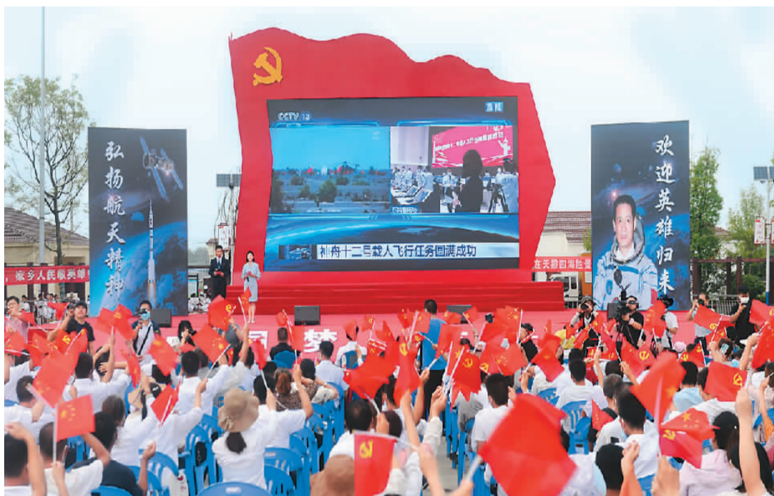
9月17日，航天员聂海胜家乡湖北省枣阳市的群众庆祝神舟十二号载人飞船返回舱成功着陆。

“作为空间站阶段首次载人飞行任务，神舟十二号意义重大，成果喜人。”人民日报9月19日发表的评论文章《太空凯旋激荡奋斗足音》指