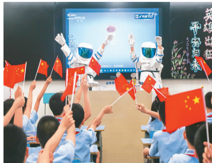
9月17日，浙江省湖州市长兴县第一小学的学生收看神舟十二号载人飞船返回地球直播。

星空浩瀚无比，探索永无止境。网友们表示，大力弘扬载人航天精神，锐意进取、攻坚克难，团结协作、拼搏奉献，我们就一定能不断开创载人航天事业发展新局面，使中国人探索太空的脚步迈得更大更远，为实现中华民族伟大复兴的中国梦作出新的更大贡献。