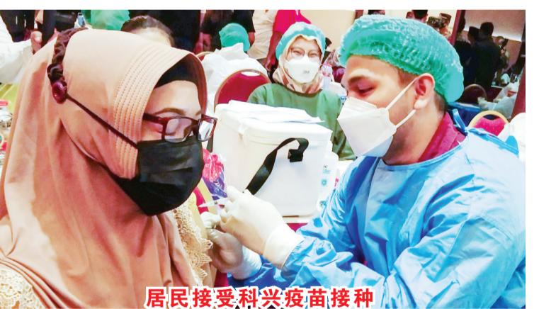
居民接受科兴疫苗接种