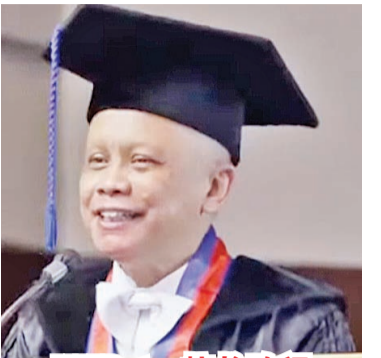
UK Petra 校长致词

2020/2021 财政年度 UK Petra 内部奖学金获得者人数记录为 1,428 名学