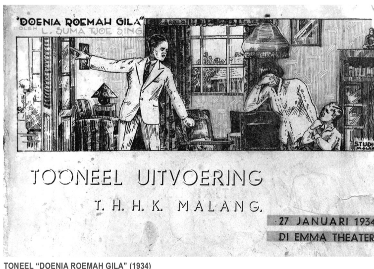
TONEEL:《疯人院的世界》“DOENIA ROEMAH GILA”(1934)