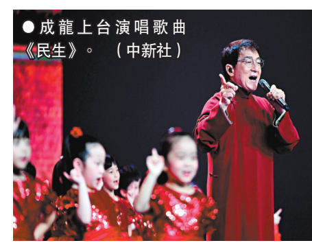
●成龍上台演唱歌曲《民生》。（中新社）