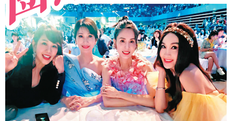
●陳松伶聯同趙雅芝、李若彤及溫碧霞合作演出。