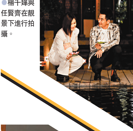
●楊千嬅與任賢齊在靚景下進行拍攝。