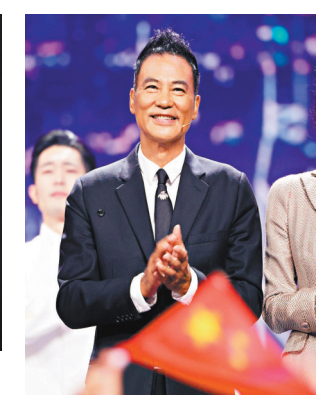
●任達華參與大灣區中秋電影音樂晚會。