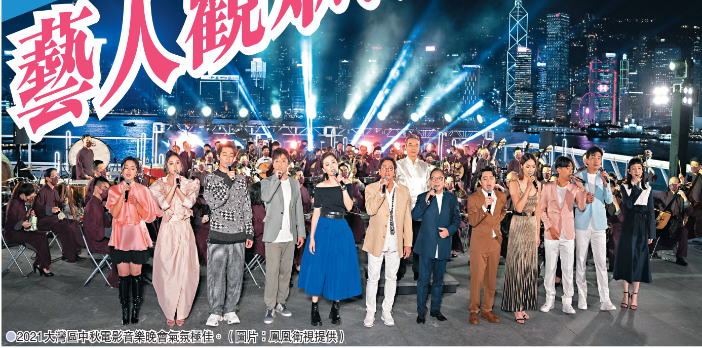
●2021大灣區中秋電影音樂晚會氣氛極佳。