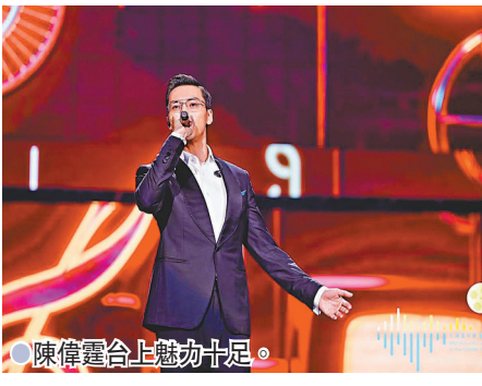
●陳偉霆台上魅力十足。