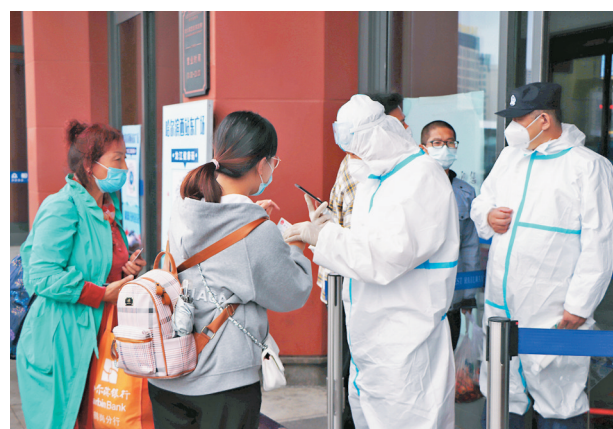
● 9月22日，哈爾濱西站，工作人員檢查旅客是否持有48小時內核酸檢測陰性證明。

召開新聞發布會，21日18時至22日16時，哈爾濱市新增新冠肺炎確診病例8例，巴彥縣7例，南崗區1例，另有3例由重點人群篩查陽性轉為確診病例。以上人員均係21日3例確診病例的密切接觸者。