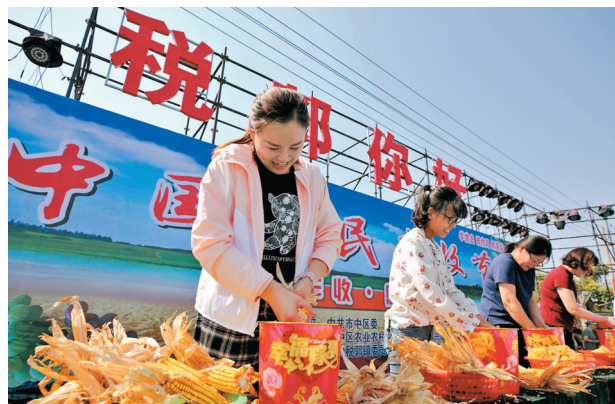
● 9月22日，山東省秦莊市稅郭鎮舉辦「趣味賽 慶豐收」活動，參賽隊員通過運糧、搥玉米、吃西瓜等趣味比賽，感受豐收的喜悅，迎接中國農民豐收節。

轉向全面推進鄉村振興。各級黨委和政府要貫徹黨中央關於「三農」工作的大政方針和決策部署，堅持農業農村優先發展，加快農業農村現代化，讓廣大農民生活芝麻開花節節高。 中國農民豐收節是第一個在國家層面專門為農民設立的節日，於2018年設立，節日時間為每年「秋分」。