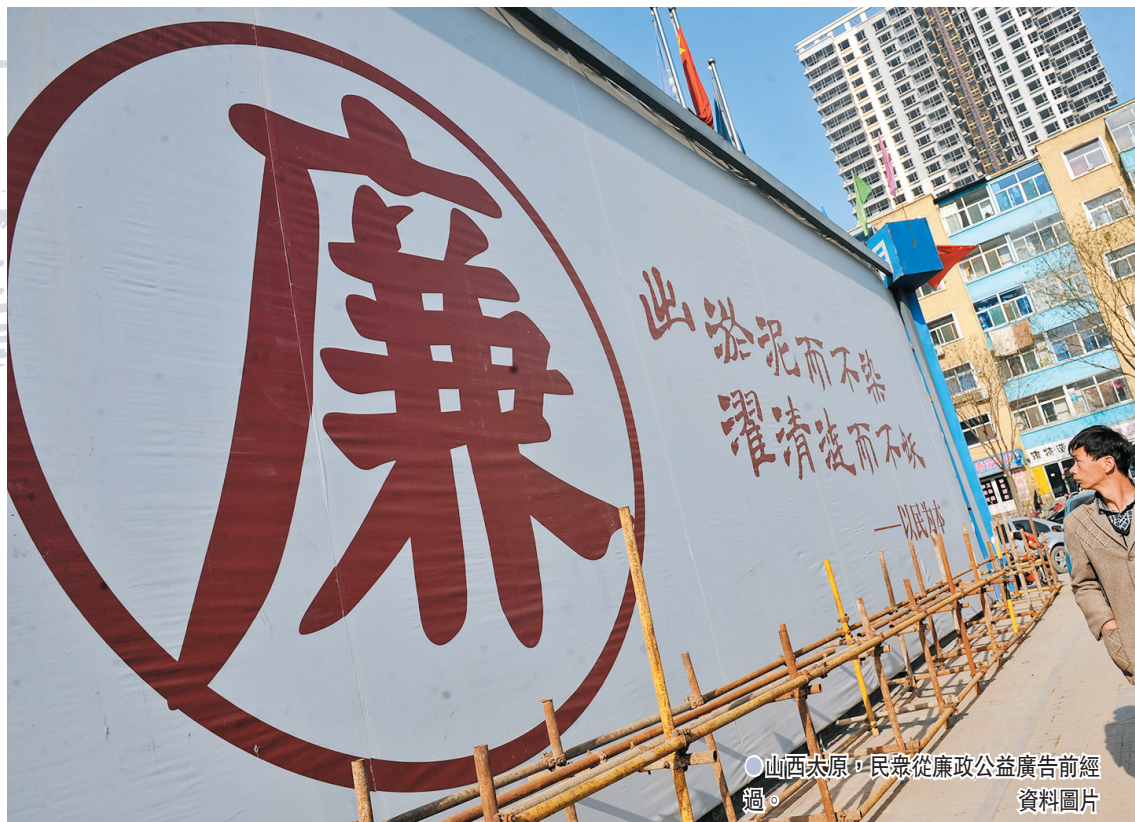
山西太原，民眾從廉政公益廣告前經過。