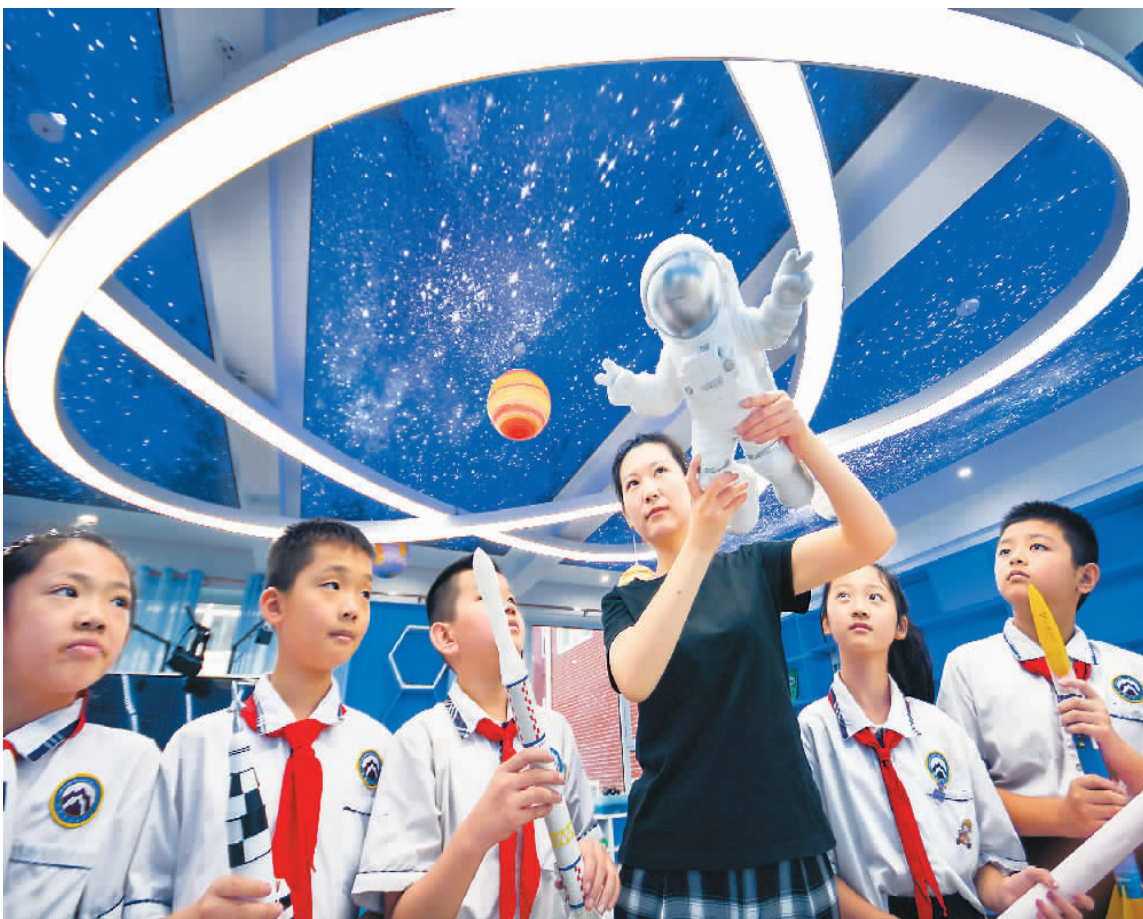
神舟十二号任务圆满成功，天舟三号顺利奔赴太空——中国航天的新成就激发了青少年走进航天、了解航天的热情，鼓励他们探索未知、敢于创新。图为河北省邯郸市邯山区实验小学老师通过模型给学生讲解航空航天知识。