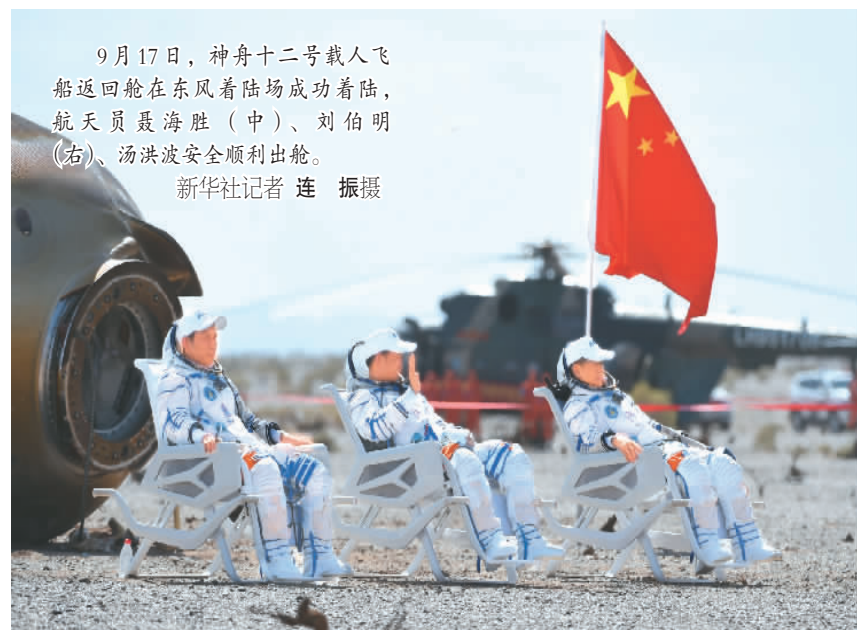
9月17日，神舟十二号载人飞船返回舱在东风着陆场成功着陆，航天员聂海胜（中）、刘伯明（右）、汤洪波安全顺利出舱。

9月17日，神舟十二号载人飞船返回舱在东风着陆场成功着陆，这也是东风着陆场迎回的第一艘载人飞船。从此以后，“东风”将成为中国载人飞船出发与回归的“母港”。为了这一目标，着陆场系统进行了20多项技术改造，构建了多专业搜救力量体系。神舟十二号的顺利回归，首次检验了东风着陆场的搜救救援能力。未来，这里将成为中国航天员进入太空可靠、安全、温暖的航天港。