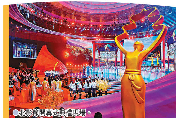
●北影節開幕式典禮現場。