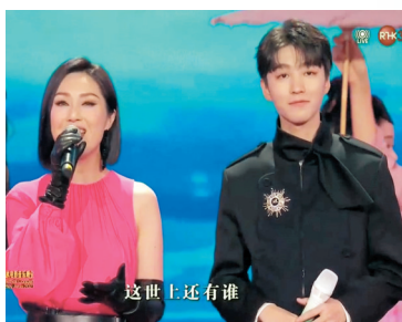
●楊千嬅與王俊凱同台演唱《花好月圓》。

香港文匯報訊 由紫荆文化集團、電影頻道節目中心、深圳市委宣傳部、鳳凰衛視等主辦的「灣區升明月」2021大灣區中秋電影音樂晚會昨晚唱響，晚會在深圳主場現場表演，亦有在香港海港城分場演出。本次晚會主辦方冀以團聚團圓為主旋律，以電影和音樂為媒介，邀請內地觀眾、港澳同胞、全球華人共享電影之美、和合之美，共同感受大灣區的文化氛圍，歡度這喜悅與溫暖的團聚時刻。兩百名內地、香港、澳門及台灣的電影人和音樂人齊聚深圳，共同唱響大灣區月圓之歌，共同唱詠家國情。