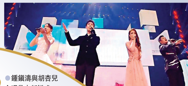
●鍾鎮濤與胡杏兒合唱帶來新鮮感。