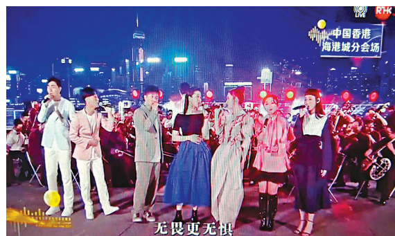
●香港藝人在海港城分會場演唱《獅子山下》。