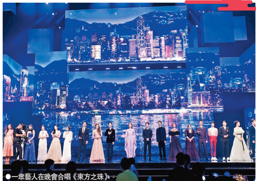
●一眾藝人在晚會合唱《東方之珠》。