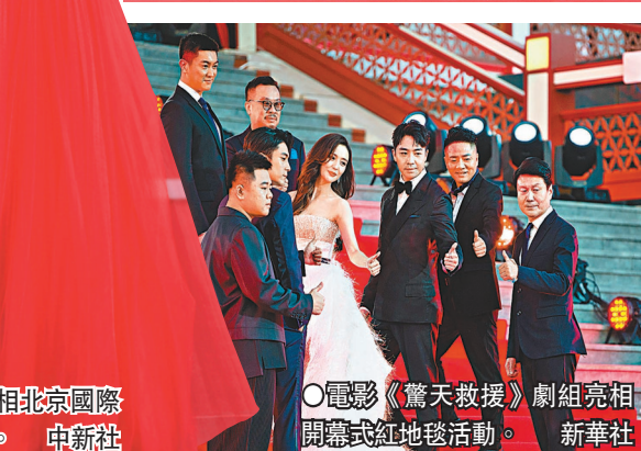
●電影《驚天救援》劇組亮相開幕式紅地毯活動。新華社