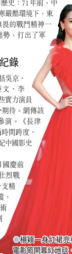
●楊穎一身紅裙亮相北京國際電影節開幕紅地毯。

據悉，《長津湖》將於9月30日國慶前夕在全國公映。一場感動國人的壯烈戰役，一部製作精良的戰爭巨製，一支精銳盡出的電影團隊，在今年國慶檔，《長津湖》將用精彩卓越的影像技術與先進的拍攝手段，帶領觀眾回到戰爭年代，沉浸式地體驗革命先輩們面臨的艱難險阻，體會新中國繁榮進步的來之不易。