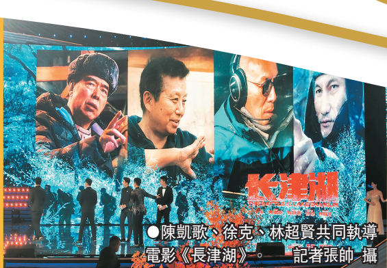
●陳凱歌、徐克、林超賢共同執導電影《長津湖》。