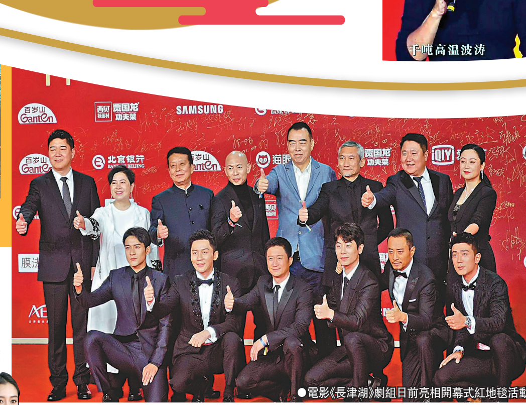
●電影《長津湖》劇組日前亮相開幕式紅地毯活動。