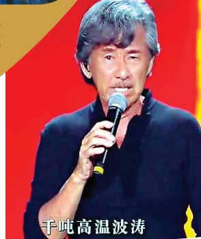
●林子祥唱歌中氣十足。