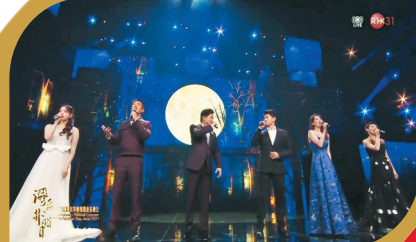
●莫華倫、吳奇隆、戴佩妮、杜江、張小斐和歐陽娜娜合唱《但願人長久》。

輪到篇章二《情融大灣區》，王源獻唱《流動的青春》，由一班歌手如鍾鎮濤和胡杏兒合唱《一生何求》，趙雅芝、陳松伶、李若彤及溫碧霞唱《月半小夜曲》，劉燁和劉愷威合唱《晚秋》，莫華倫、吳奇隆、戴佩妮、杜江、張小斐和歐陽娜娜合唱《但願人長久》等「月亮組曲」。之後，黃曉明、容祖兒、張韶涵、劉乃奇合唱歌曲《國家》。至於篇章三《我的中國心》，有成龍唱出歌曲《民生》。最後，群星大合唱《我的中國心》，主會場的鍾鎮濤、任達華、舒淇、易烱千璽、關曉彤、劉昊然等聯同在香港會場的張明敏、譚詠麟、王祖藍、周勵淇、李亞男、方力申、周柏豪、許靖韻、陳明熹、羅鈺滿、趙浚承、炎明熹演出，將晚會氣氛推向高潮，觀眾在溫情洋溢的氣氛包圍下，度過愉快的中秋明月夜。