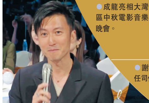
●謝霆鋒鮮有擔任司儀。

香港電影的興起讓粵語歌曲成了無數歌迷、影迷心中最難忘的青春回憶和心靈慰藉。可以說，每個人心中都有一首粵語歌。大灣區中秋電影音樂晚會上，既有《男兒當自強》、《敢愛敢做》、《晚秋》、《一生何求》、《月半小夜曲》等經典粵語歌曲，反覆撥動人們記憶深處的那根心弦，更有承載着港人成長記憶的《麥兜與雞》和成為香港市民同舟共濟、奮發圖強象徵的《獅子山下》。