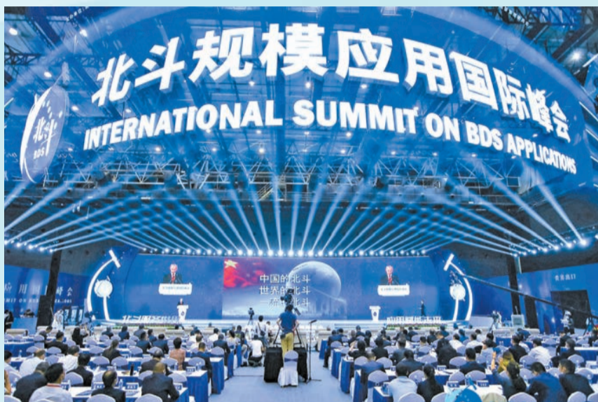
首屆北斗規模應用國際峰會在長沙召開。

當前，長沙中歐班列數量進入全國第一方陣，國際經貿「朋友圈」拓展至200多個國家和地區，在湘投資世界500強