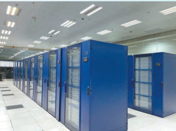
「天河」系列超級計算機頻顯「中國力量」。