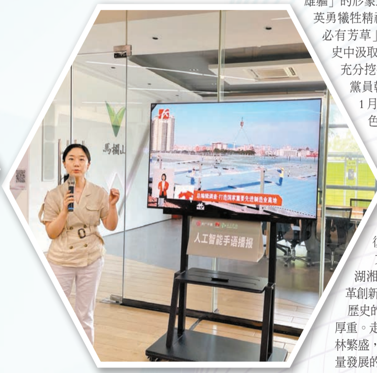
馬欄山企業湖南長廣千博科技人工智能手語電視播報系統被廣泛運用。

文源深、文脈廣、文氣足的湖湘文化正成為激蕩湖湘兒女改革創新的澎湃動力。歷史的分量，歷經歲月沉積而更顯厚重。走過秋收冬藏、春暖花開、夏林繁盛，又一圈年輪刻在了湖南高質量發展的征程中。殷殷囑託，綿綿厚望，牢記心間，湖南必將譜寫更恢弘的篇章。