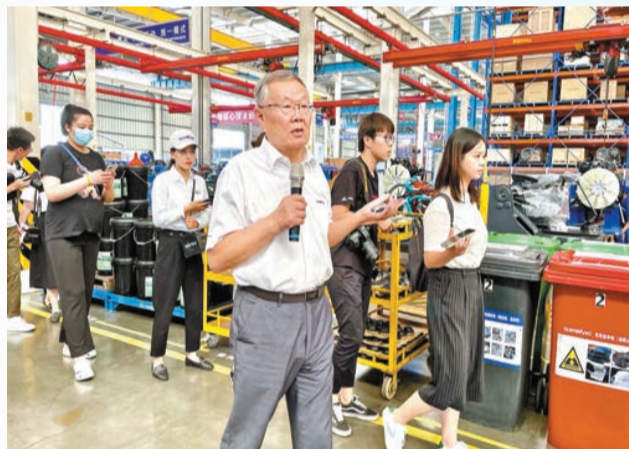
山河智能董事長何清華表示，一年前總書記來企業調研「讓大企業受到了極大的鼓舞，也深深感受到責任在肩，使命在前」。

可以說，打造「三個高地」，助推湖南實現了更高質量、更有效率、更加公平、更可持續、更為安全的發展。