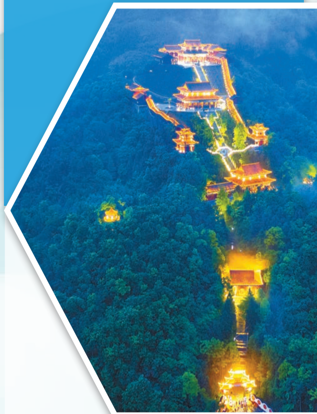
「綠水青山就是金山銀山」在湖南得到生動實踐。