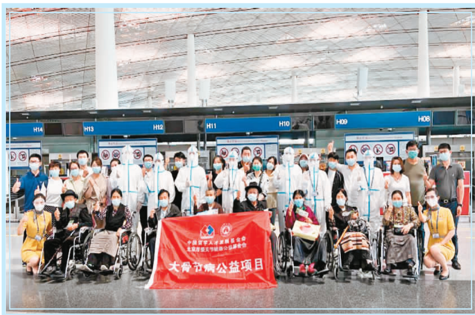
8月20日,中国留学人才发展基金会大骨节病公益项目2021年第二批来京治疗的8位患者顺利结束手术和康复治疗,出院返乡。

大骨节病是一种地方性、慢性、多发性、变形性骨关节病。西藏自治区昌都市洛隆县是大骨节病重灾区,生活在这里的不少群众长期饱受大骨节病折磨,不仅严重影响劳动能力,甚至连正常行走都是奢望——重症大骨节病患者需要常年依靠拐杖、轮椅生活。