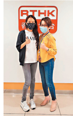
莫文蔚指近年香港樂壇變得活潑多了。

「華語樂壇天后」Karen終於鳥倦知還回到香港這個老家，她說全世界跑了這麼多的地方，發覺自己還是最愛香港！其實，香港人也很愛她啊！