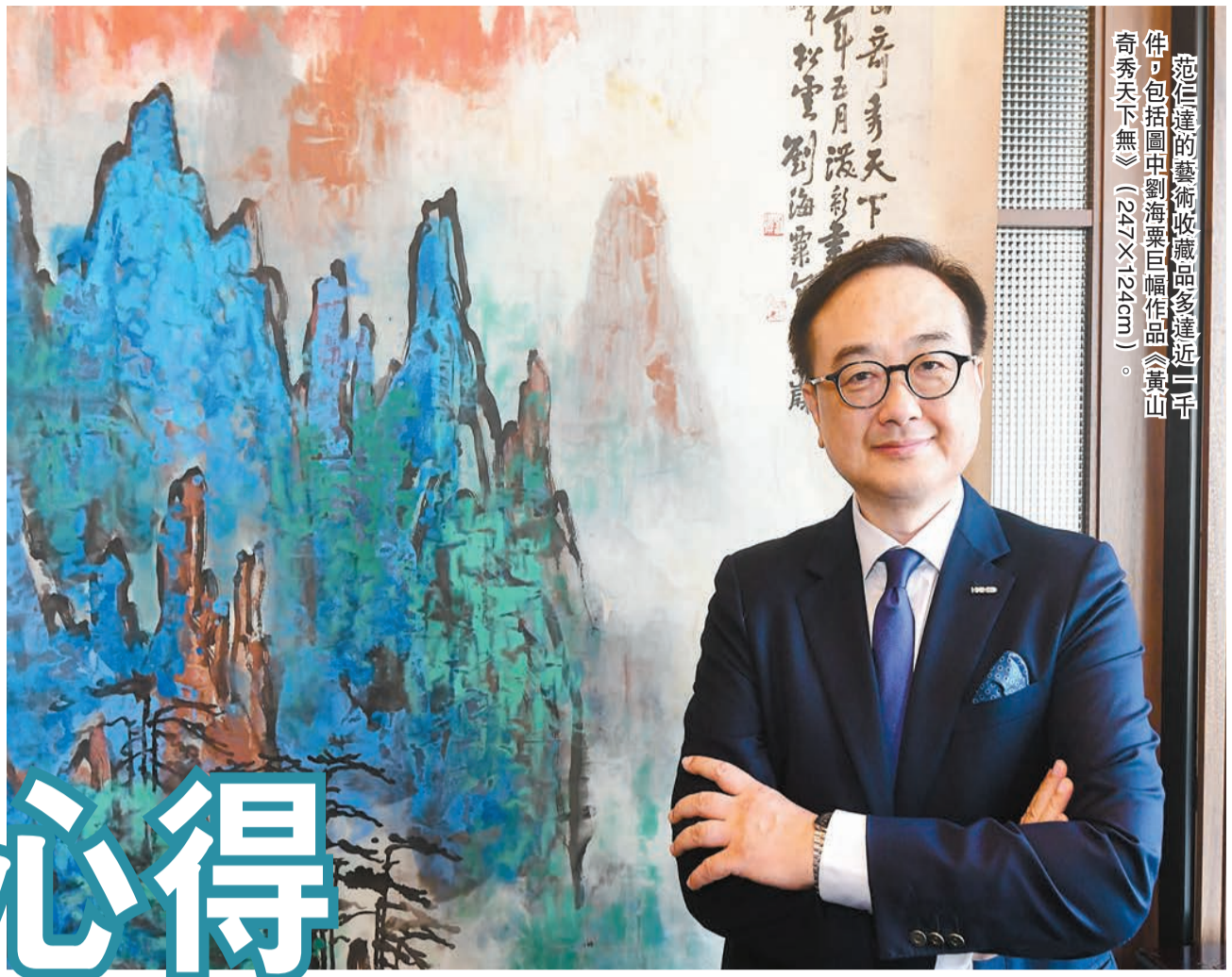
范仁達的藝術收藏品多達近三千件，包括圖中劉海粟巨幅作品《黃山奇秀天下無》（247x124cm）。

范仁達介紹，相比應酬畫更喜歡收藏精品畫作，如這幅張大千的《澗墨荷花》（192x96cm）用上金箋，絕非應酬畫。