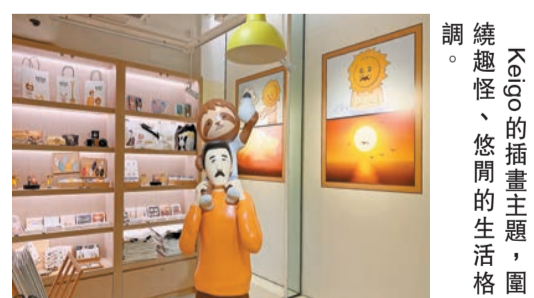
Keigo的插畫主題，圍繞趣怪、悠閒的生活格調。