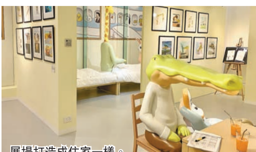
展場打造成住家一樣。