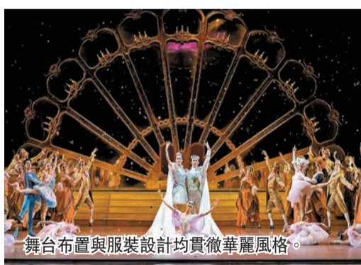
舞台布置與服裝設計均貫徹華麗風格。