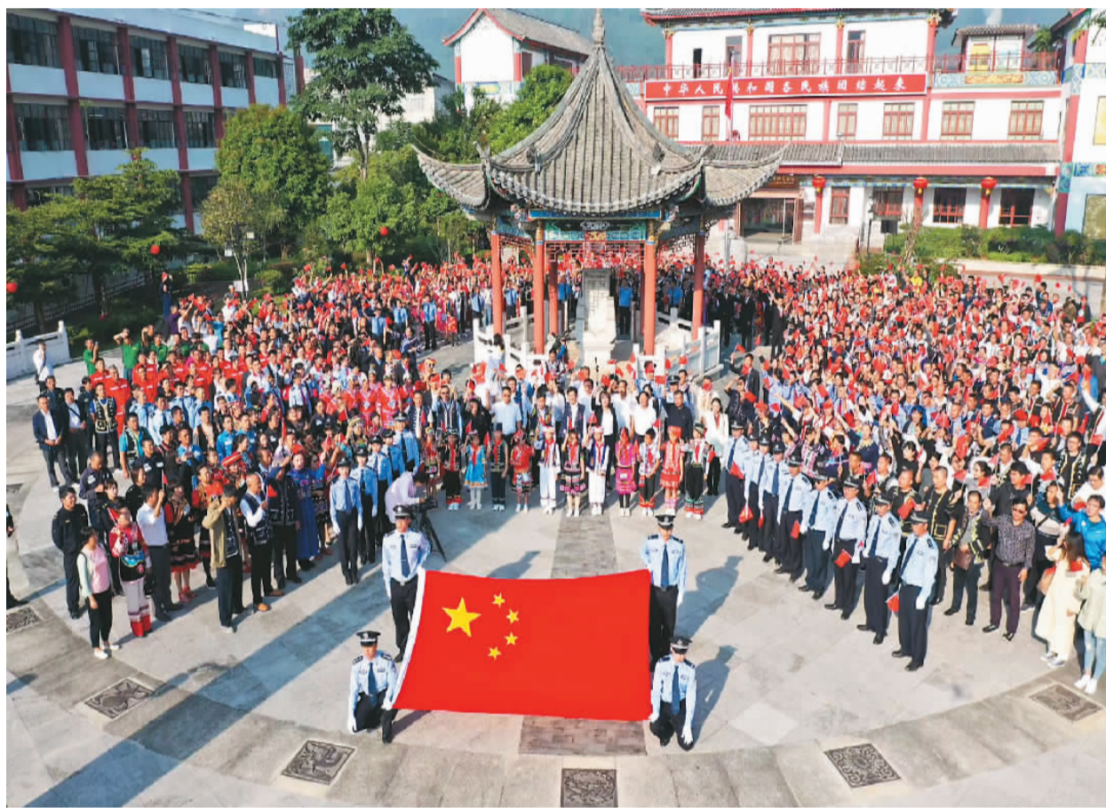
民族团结誓词碑已成为当地开展民族团结教育活动的重要场所。

民族团结誓词碑矗立在普洱县城西北方, 在蓝天白云下或暴风骤雨中自带气场, 显示出沉稳、向上的生命力。