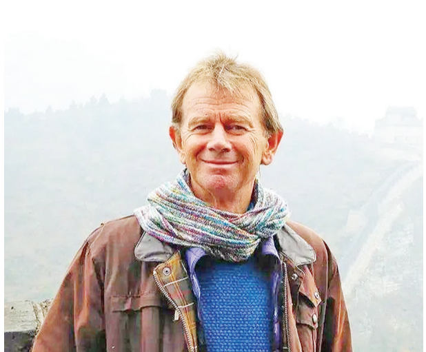
迈克尔·伍德在中国

世界纪录片大师尤里斯·伊文思曾说，创作者应该诚实地呈现人，诚实地呈现自己的感动。伍德的纪录片饱含着对中国文化的深情，并成功将这份感情传递给了文化各异经历不同的观众。也许从中我们可以得出启示：国家文化的认可，不一定需要宏大叙事；动人的真情不一定需要山崩地裂的情节。美好的人性，才是这个世界都能接受的东西。