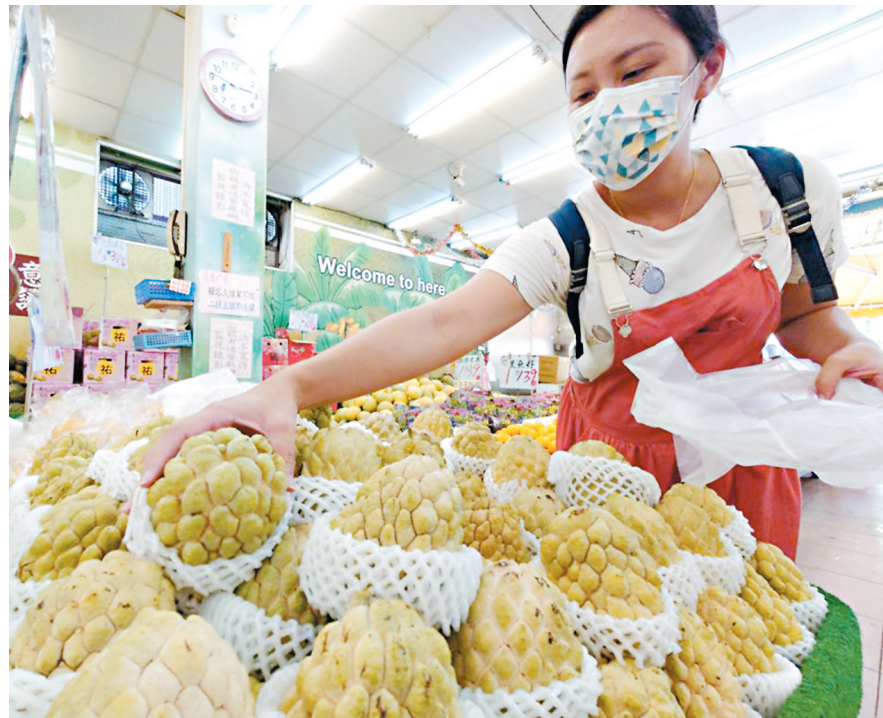
水果市場上出售的釋迦和蓮霧（右）。

香港文匯報訊（記者 馬靜 北京報道）海關總署18日發布通知，因檢出檢疫性有害生物，於20日起暫停台灣地區的釋迦（或稱番鬼荔枝）和蓮霧輸入大陸。消息傳出後，親綠媒體「三立新聞」迅速炒作，在報道中使用「鳳梨翻版又來了」的聳動字眼。另有台灣媒體報道稱，加上今年3月大陸暫停進口的台灣菠蘿（鳳梨），若之後大陸不再進口這三項水果，台灣每年將損失近40億元（新台幣，下同）。