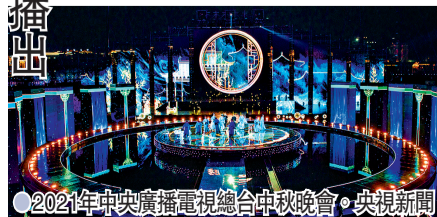
2021年中央廣播電視總台中秋晚會。央視新聞

香港文匯報訊 據央視新聞報導：《2021年中央廣播電視總台中秋晚會》將於9月21日晚20時與全球觀眾見面，這是總台秋晚首次在海外同步播出。美國中文電視台（Sinovision）、加拿大新動力傳媒（Xinflix Media）、肯尼亞新視奇電視台（Switch TV）、阿聯酋中阿衛視（CATV）、馬來西亞Enjoy TV等境外媒體以及澳視、澳門有線電視同步播出。為便於海外受眾理解農曆中秋節的文化內涵，國際視頻通訊社首次對晚會節目配以英文解說，將中秋節的風俗習慣等做詳盡介紹。播出當晚，還將同步編發晚會集錦，向全球媒體廣泛投送。央視網也將通過Facebook平台CCTV中文眼、CCTV全球頁英語眼及YouTube平台CCTV春晚頻道直播中秋晚會。總台秋晚引發海內外媒體廣泛關注，《中國日報》《國際日報》《時代論壇報》等均對晚會進行了報導。