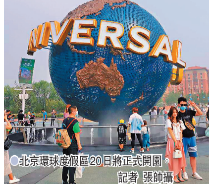
北京環球度假區20日將正式開園。

香港文匯報訊（記者 張帥 北京報導）經過近期內部壓力測試和試運行，9月20日上午，北京環球度假區舉辦了盛大開園儀式，並於當日中午12時迎來首批遊客。相關統計稱，北京環球度假區每年預計接待遊客數量在1,000萬至1,200萬人次，年營業額100億元人民幣計算，相當於2020年北京GDP的0.28%，每年將對北京旅遊收入產生4.8%的帶動作用。