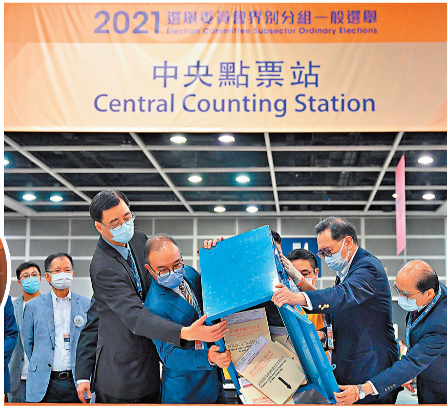
香港選舉委員會界別分組一般選舉19日於灣仔會展中心開箱點票。圖為政制及內地事務局局長曾國衛(左四)和選舉管理委員會主席馮驊(右二)等嘉賓一同倒出首箱選票。

林鄭月娥19日上午在政制及內地事務局局長曾國衛陪同下巡視灣仔會展投票站。她向傳媒表示，是次選舉是完善選舉制度後的首場選舉，為香港帶來新局面，意義非常重大，同時亦為未來另外兩場選舉，即今年12月的立法會選舉及明年3月的行政長官選舉打好基礎。她指，香港的公開選舉一向以公平、公開、公正、廉潔和誠實見稱，相信是次選舉經過各方努力，同樣可以做到。