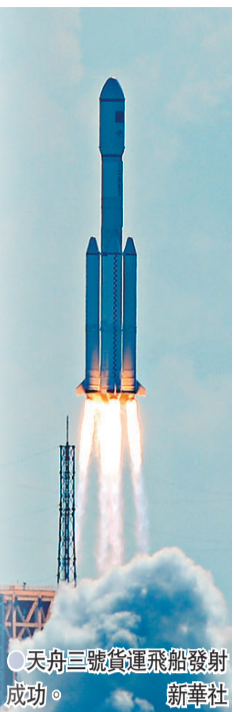
天舟三號貨運飛船發射成功。新華社

金貴 天舟三號帶的貨物中最「金貴」的要數艙外航天服，其主要功能為為航天员提供太空中生存所需的供氧、調溫、輻射防護等。這套裝備重達90多公斤，價格超過人民幣8位數。