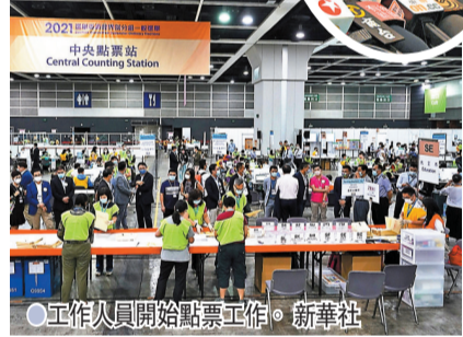
工作人員開始點票工作。

能有行政機關與立法機關理性互動，切實提升特區政府管治效能。新選舉制度也提供堅實基礎，相信在全社會大眾支持下，香港可全面準確貫徹「一國兩制」原則，維持長期繁榮穩定。