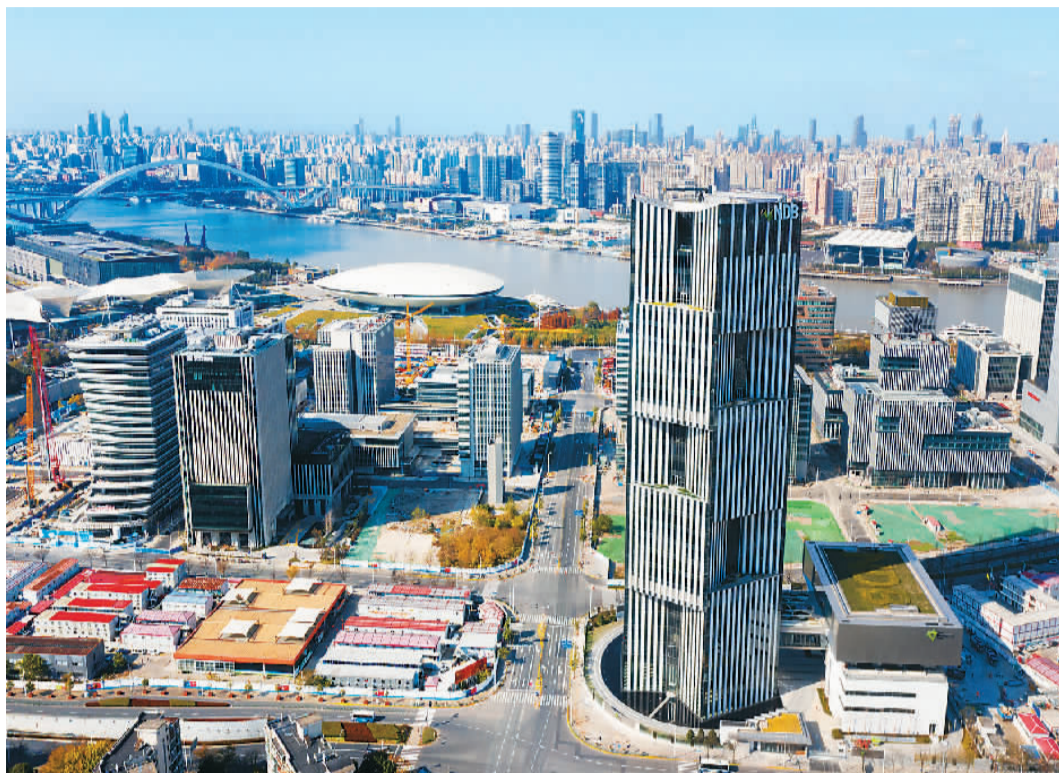
位于上海市浦东新区世博园区内的金砖国家新开发银行大楼。

中国国家主席习近平在讲话中指出，面对挑战，金砖国家要展现担当，推动践行真正的多边主义，推动全球团结抗疫，推动开放创新增长，推动共同发展。掷地有声的中国声音，进一步指明金砖合作未来的发展目标，引发国际社会的共鸣与点赞。