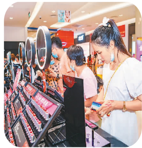
海南省海口市免税店内，顾客正在选购免稅化妆品。

新加坡《联合早报》网站报道称，在第18届中国—东盟博览会开幕式上，新加坡副总理王瑞杰发表视频致辞时表示，尽管受制于新冠肺炎疫情，但东盟和中国之间的贸易比去年有所增长，双方都将建立更紧密的经济联系中受益。新中（重庆）战略性互联互通示范项目旗下的国际陆海贸易新通道，有潜力成为惠及本区域的另一条贸易路线。