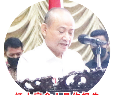
红十字会人员作报告

PMI作为参与处理Covid-19的机构之一,与政府和各方协同工作。今年的周年纪念主题是“为他人而一起行动”。