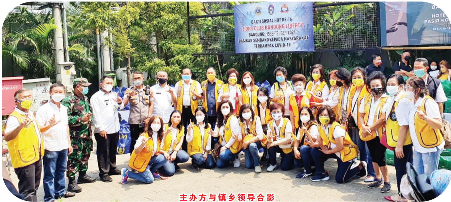
主办方与镇乡领导合影

阿伊镇长致词赞赏自由狮子会所作慈善活动。他说:“在多数人们因疫情而痛苦的时候,有狮子会姐妹们进行这样的活动,让我们感到非常感动和感激,疫情真的带给我们很多问题,但是善心人的援手也体现了人性的美好和族群间的融洽和情谊。祝贺自由狮子会诞辰快乐,更蒙真主赐福,赐给各位安康和幸福。”(雪妮报道)