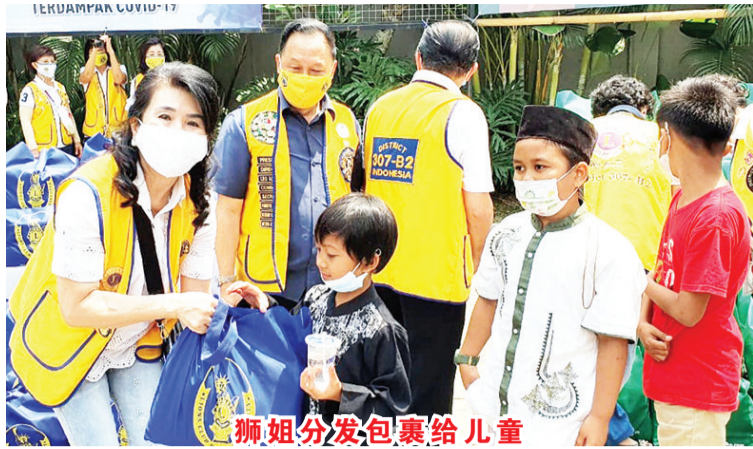
狮姐分发包裹给儿童