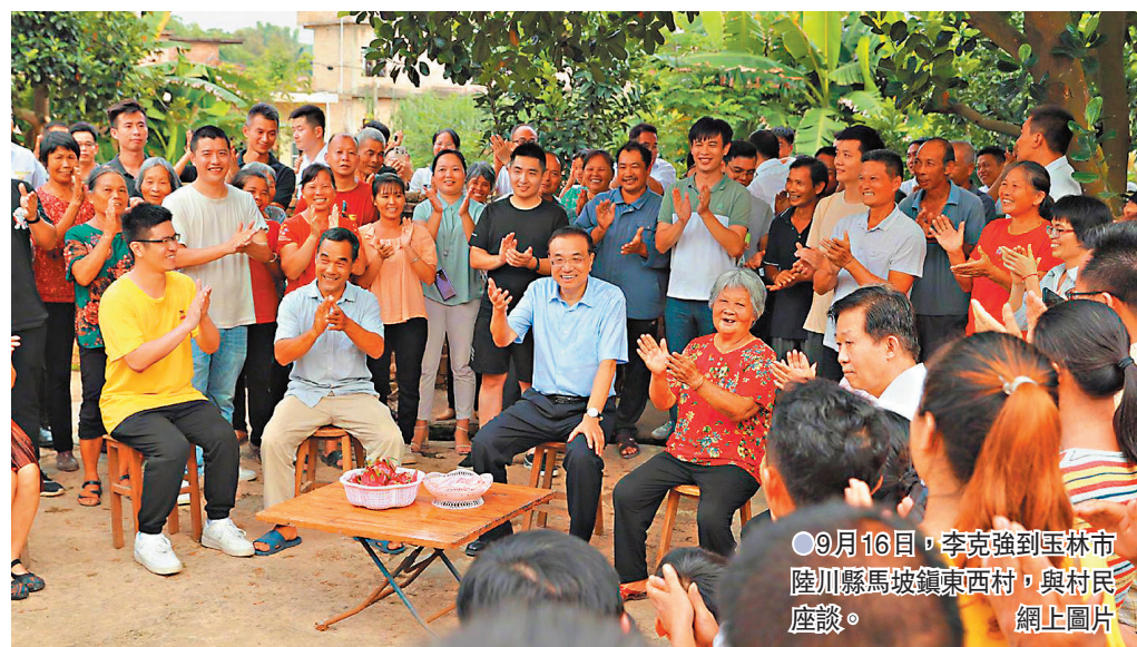
9月16日，李克強到玉林市陸川縣馬坡鎮東西村，與村民座談。

萬戶送去了甜。國家將在甘蔗良種培育、增強糖業抗風險能力上加大支持。李克強與村民圍坐拉家常。有大學畢業生說，在附近創業辦企業帶動了300人就業，李克強稱讚這讓群眾就近打工掙錢，又照顧老人孩子。針對鄉親們的期盼，李克強說，現在生活好起來，有很多新需求，要問政於民，盡力而為、量力而行，把群眾盼望的事情辦好。