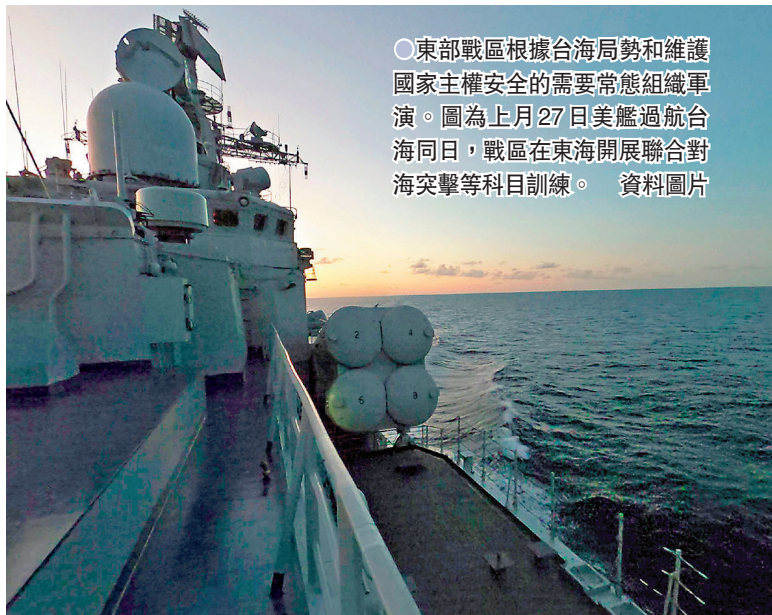
東部戰區根據台海局勢和維護國家主權安全的需要常態組織軍演。圖為上月27日美艦過航台海同日，戰區在東海開展聯合對海空擊等科目訓練。