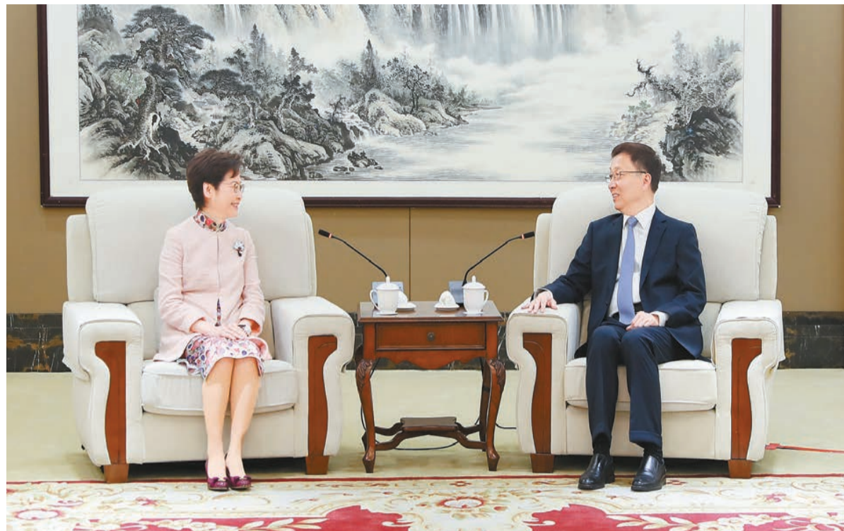
昨日，韓正在深圳會見林鄭月娥。