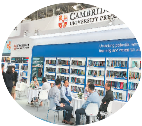
剑桥大学出版社展位