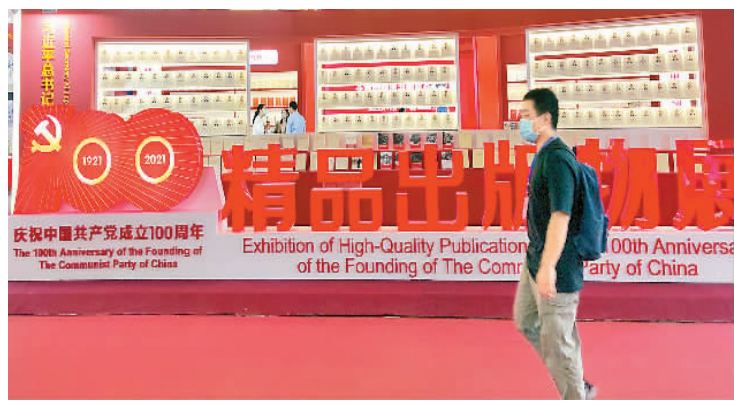
庆祝中国共产党成立100周年精品出版物展

中央政治局委员、中宣部部长黄坤明参观博览会时强调，要坚持以习近平新时代中国特色社会主义思想为指导，立足中国、面向世界，推出更多富有中国特色、体现中国精神、蕴含中国智慧的优秀出版物，为塑造可信可爱可敬的中国形象贡献出版力量。