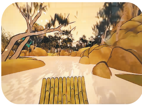
左为中信出版社展位，右为VR“王原祁《皆山园图卷》”画面