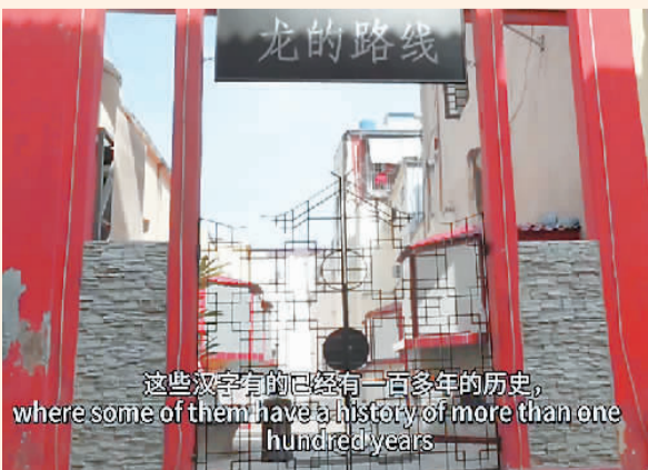
古巴哈瓦那街头的汉字招牌。

无论是街头的汉字标识，场馆里的中文书籍和报纸，还是融合于艺术作品的汉字元素，都是一种文化符号、一道风景，是联结中国和古巴两国友谊的纽带。它们历久弥新，见证了多元文明的交融。