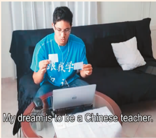
佛得角青年龙勇生的梦想是成为一名中文老师。因为他在网上教授中文。

“汉字风景：在我的城市里遇见汉字”项目是由中外语言交流合作中心主办的短视频征集活动，旨在通过视频创作的方式，激发各国民众观察和感知他们生活环境中的汉字，讲述世界各地公共空间中出现的汉字故事，以及背后一个个感人、新奇、有趣又令人难忘的文化交融的故事。