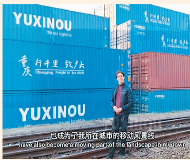
集装箱上的汉字。海洋正在介绍来自中国的

中欧班列上移动的汉字，不仅为“一带一路”沿线国家带来别样风景，而且生动地诠释了“美美与共”的美好理念。