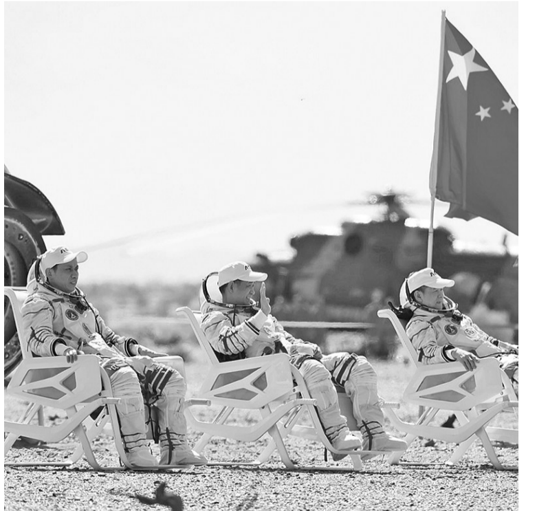
9月17日,神舟十二号载人飞船返回舱在东风着陆场成功着陆。这是航天员聂海胜(中)、刘伯明(右)、汤洪波安全顺利出舱。