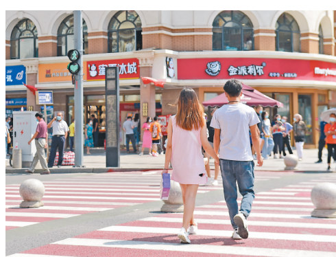
一對情侶通過烏魯木齊大巴扎景區附近路口，這裏的信號燈出現了心形裝飾。

課題組構建了一套涵蓋城市自然安全、治安安全、食品安全、交通安全、公共衛生安全、生態安全、公共場所設施安全、社會保障安全、信息安全等9個城市公共安全感要素，各項指標指數排名依次是公共場所設施安全感、自然安全感、生態安全感、交通安全感、治安安全感、公共衛生安全感、社會保障安全感、食品安全感、信息安全感。