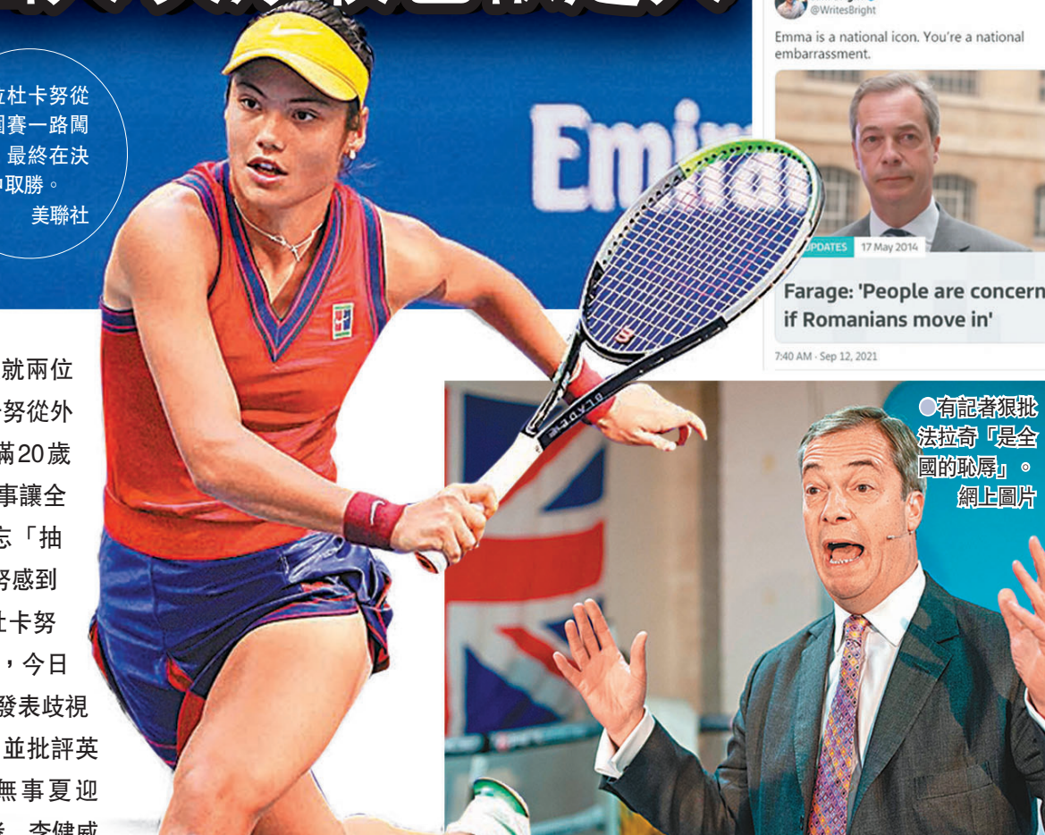
● 有記者狠批法拉奇「是全國的恥辱」。