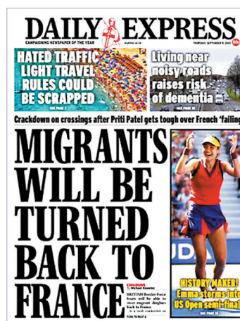
MIGRANTS WILL BE TURNED BACK TO FRANCE

劍橋市議員布特於9年前從羅馬尼亞移居英國，他認為移民不應在取得重大成就後，才能在英國獲得接納和擁有權利，「對許多人而言，英國人只是一個多元文化和多元種族的身份，在種族背景之外，我們有更多特徵值得關注。」