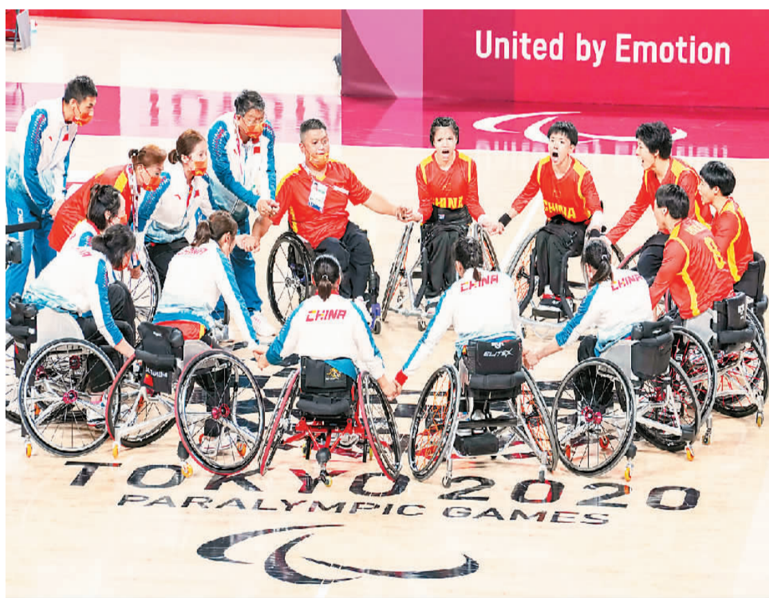
中国轮椅篮球女队在比赛后庆祝。