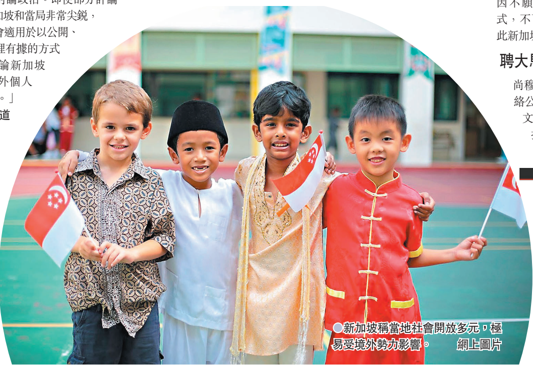
新加坡稱當地社會開放多元，極易受境外勢力影響。