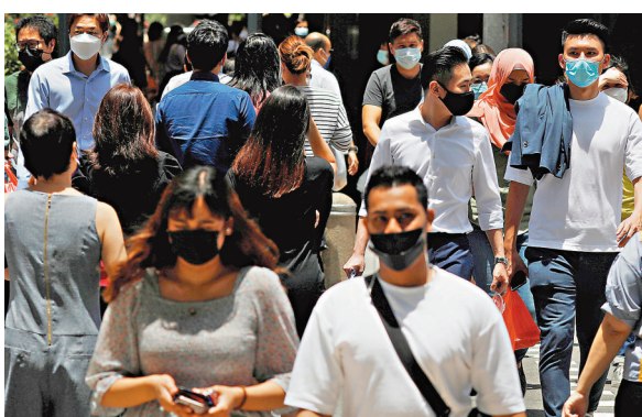
新加坡當局希望同時提升民眾分辨不實訊息的能力。 路透社

新加坡內政部指出，外來干預對新加坡的政治主權和國家安全構成嚴重威脅。在進行「敵意訊息宣傳」時，惡意的外國行為體可能試圖在政治議題上誤導新加坡人，通過渲染種族與宗教等具爭議的議題來挑起不滿與不和，或試圖削弱對新加坡公共機構的信心和信任。