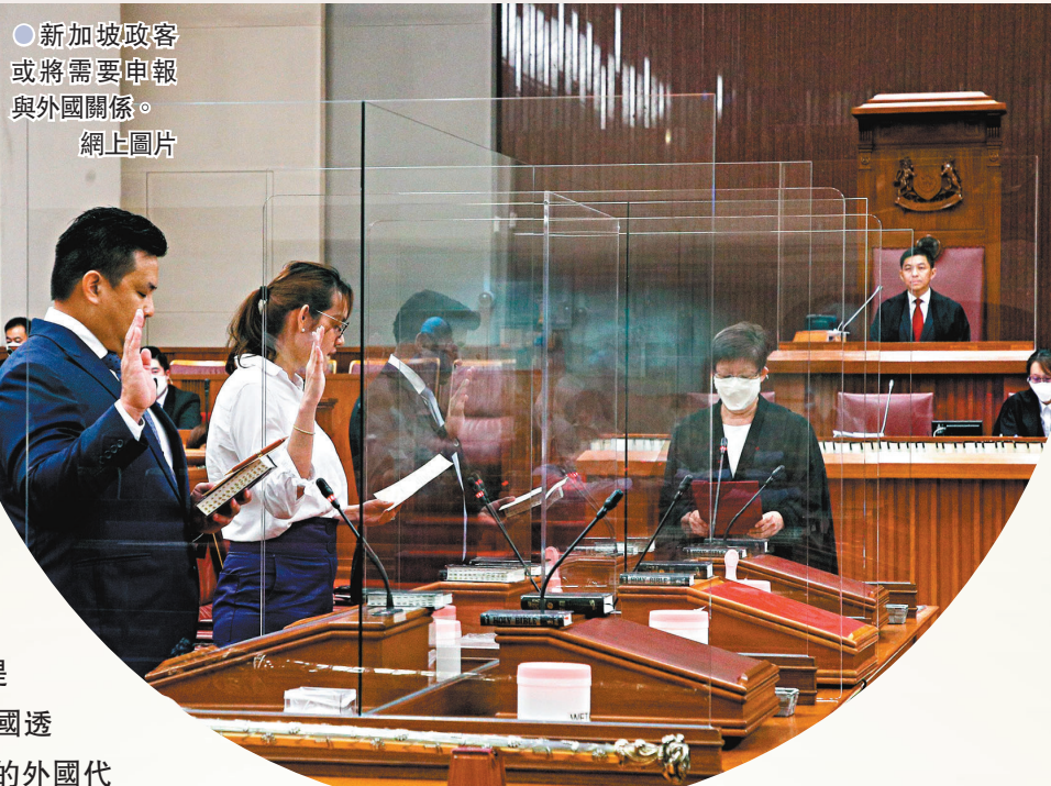
新加坡政客或將需要申報與外國關係。

全球多國近年相繼立法，預防外國勢力干預內部事務、影響社會穩定，新加坡內政部13日便向國會提交新法案，旨在預防、發現與阻止外國代理人干涉新加坡內政，具體措施包括強制社交平台披露相關用戶訊息、刪除敵對內容，甚至封禁特定賬戶。內政部強調新加坡社會開放多元，極易受境外勢力影響，因此與其他國家一樣需要立法保障政治主權和國家安全。