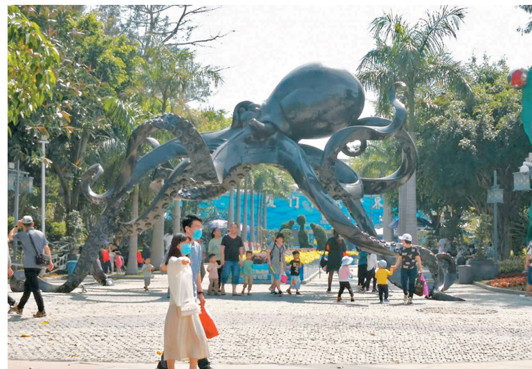
●廈門防疫形勢嚴峻,對今年中秋、國慶旅遊旺季吸金能力造成了挑戰。圖為廈門海底世界。

國慶這段小高峰得以「回血」。但屋漏偏逢連夜雨,福建這波疫情,讓她的希望又落了空:「13日晚上,訂單又一夜之間全部退光。」一個月十幾萬元(人民幣,下同)的房租、水電等硬性開支,讓該業者欲哭無淚。「我們8月的營業額2,000多元,說出來都沒人相信。第三季度徹底泡湯了,三個月單單硬性開支將近五十萬元,國慶黃金週也不敢奢望了。可能很多人覺得我們利潤高,但其實都是在替房東打