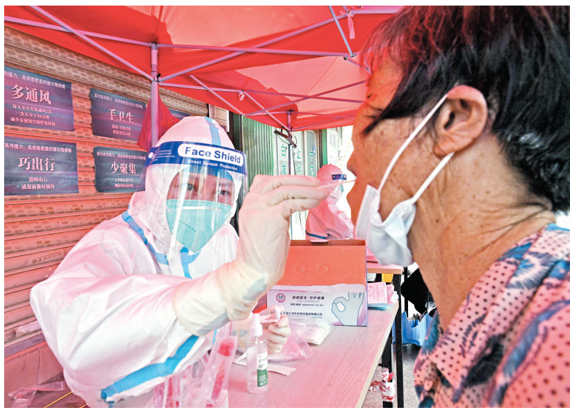
●9月13日,福建省泉州市泉港區開展全員核酸檢測,醫務人員為市民做核酸採樣。