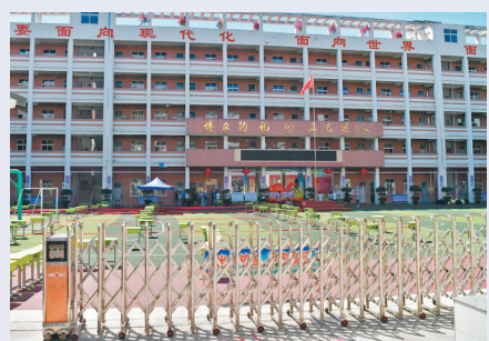
●9月13日,福建仙游莆田學院附屬實驗小學已暫停線下教學。 中新社

由於恰逢開學季,學校成為福建此次疫情的一個集中傳播點。福建由此進一步加強學校防疫。在莆田,除了楓亭鎮鋪頭小學已有16名學生感染外,還有5所學校的7名師生也在感染之列。從9月13日起,莆田暫停全市中小學、幼兒園及各類教育培訓機構線下教學,改為線上教學。廈門市13日通報的病例中,除前述同安工廠群組外,還有一例為位於市區思明區內一家醫院的後勤服務人員確診,但具體源頭不明。思明區即日也公布所有中小學幼兒園14日起全部改為線上教學,「我們昨晚(12日)睡前就看到了零星的一些消息,早上的進一步消息讓我們覺得,這次疫情比上次廈門的疫情更加分散,危險系數更高。所以今天早上就給孩子請假了。」思明區檳榔小學學生家長葉小姐告訴香港文匯報記者。思明區也有多個區域通知民眾封控進行核酸檢測。