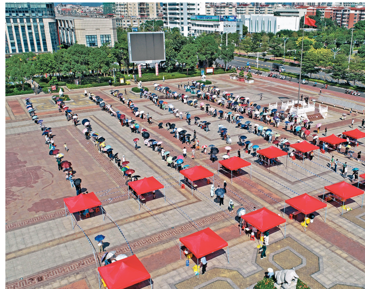
●9月13日,福建省泉州市泉港區開展全員核酸檢測,市民有序排隊等候做核酸採樣。