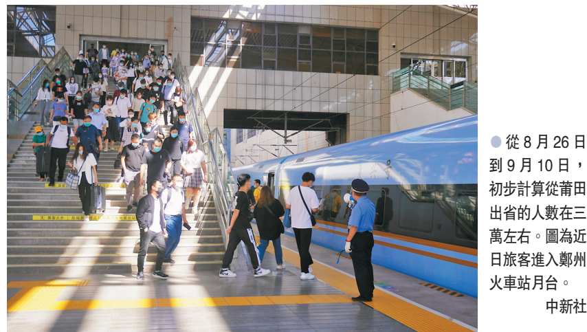
●從8月26日到9月10日,初步計算從莆田出省的人數在三萬左右。圖為近日旅客進入鄭州火車站月台。

對於本輪疫情何時能得到控制,南開大學統計與數據科學學院黃森忠教授團隊初步測算判斷,此輪疫情在理想情況下最終感染人數會在100人至300人之間,屬於中等規模,或將在四個星期內,即至10月初得到控制。據《健康時報》報道,黃森忠表示,目前,可能的外溢情況尚不明,根據流行病學規律及國內的抗疫經驗,可能外溢的「暴雷」應該在9月19日前出現,若出現外溢,本地及關聯病例的總規模,應該能控制在500例以內。