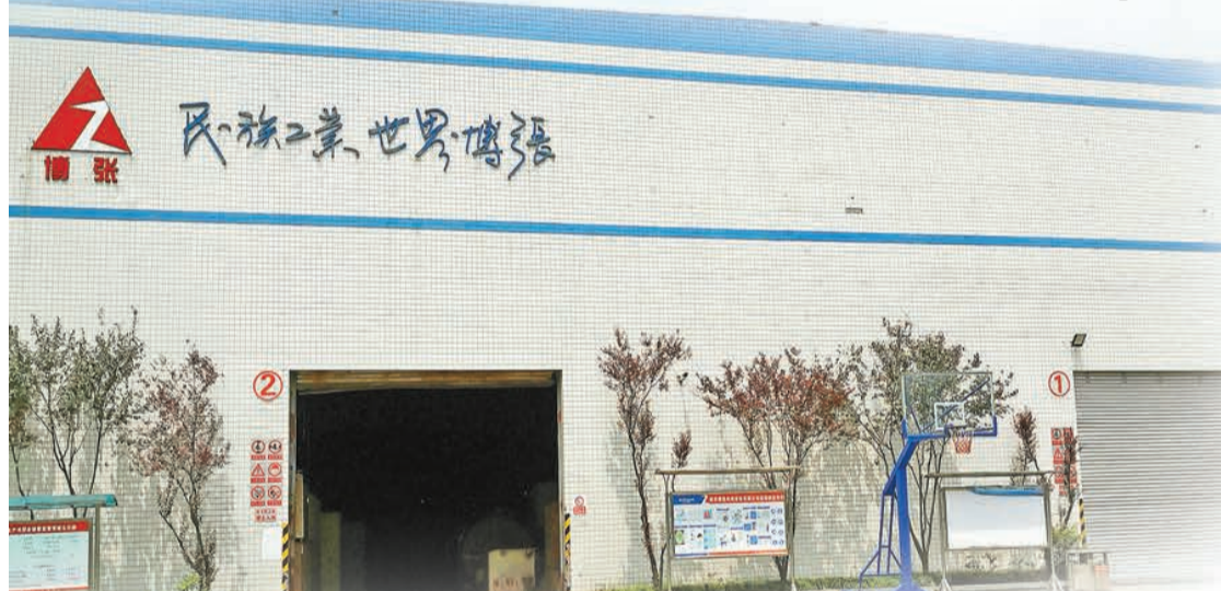
座右銘「民族工業·世界博張」銘刻在公司最醒目的位置。