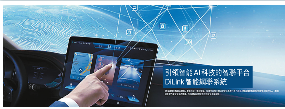
豪華智能打造沉浸式交互體驗。

漢EV標準續航版豪華型適配全國公共充電樁，兼容多種充電方式，從30%快充至80%電量最快只需25分鐘，500公里+的純電續航能力，對生活在充電基礎設施完善的一線城市的用戶來說足以覆蓋日常出行需求，每日通勤60公里，充滿一次電一周出行無壓力；對生活在長三角、珠三角等城市集群