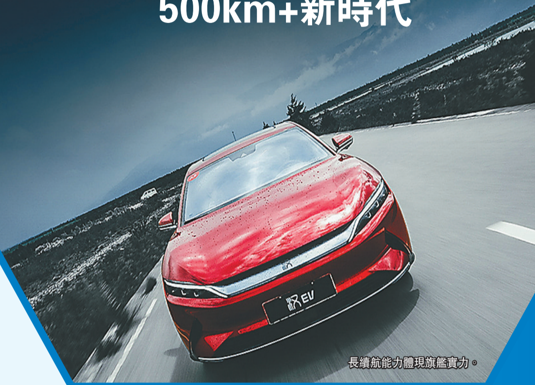
長續航能力體現旗艦實力。