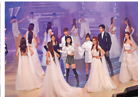
●《聲夢》歌手參與演出。