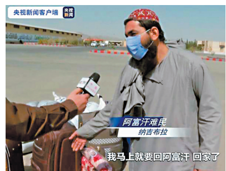
●受訪者見局勢穩定，希望回家。網上圖片