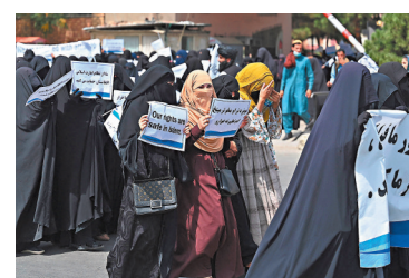
●親塔利班婦女到喀布爾一所大學集會。

阿富汗臨時政府12日公布高等教育政策，稱女性可以在大學裏學習，但必須與男生分開課室上課，又或至少在同一課室內以布簾分隔男女學生。