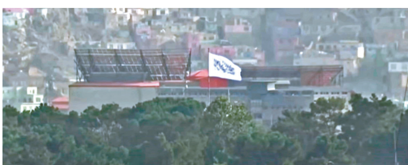
●總統府升起塔利班旗幟。

塔利班文化委員會多媒體負責人穆塔基稱，升旗儀式由代理總理哈桑主持，標誌臨時政府正式運作。穆賈希德表示，塔利班會致力維護國家安全，並實施「明確政策」符合國際社會要求，保證阿富汗不會威脅其他國家。阿富汗前總統卡爾扎伊則呼籲塔利班確保社會和平穩定，希望日後能成立具包容性的新政府。